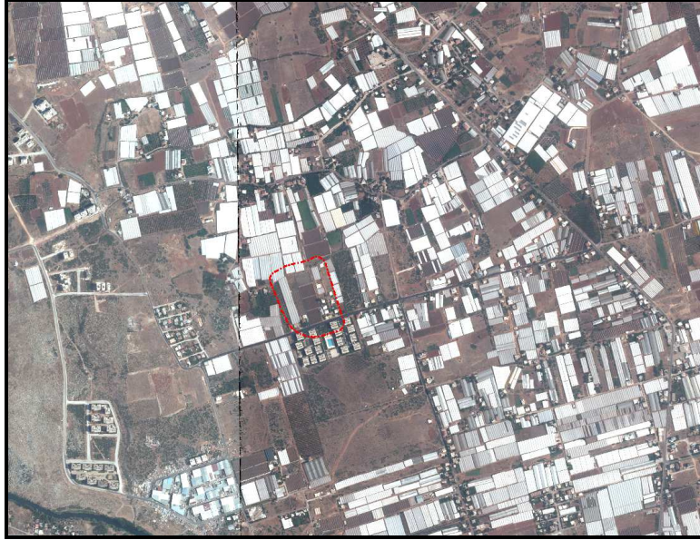
Şekil 1. Hava Fotoğrafı

Planlama alanı, Antalya Kepez Belediyesi, Varsak Zeytinlik Mahallesi sınırları içerisinde yer alan 3620, 3621, 3622 ve 3598 nolu parsellerden oluşmaktadır. O25-B1 nolu 1/25.000 ölçekli Nazım İmar Planı paftasına giren planlama alanı yaklaşık 2.6 ha'lık alanı kapsamaktadır.