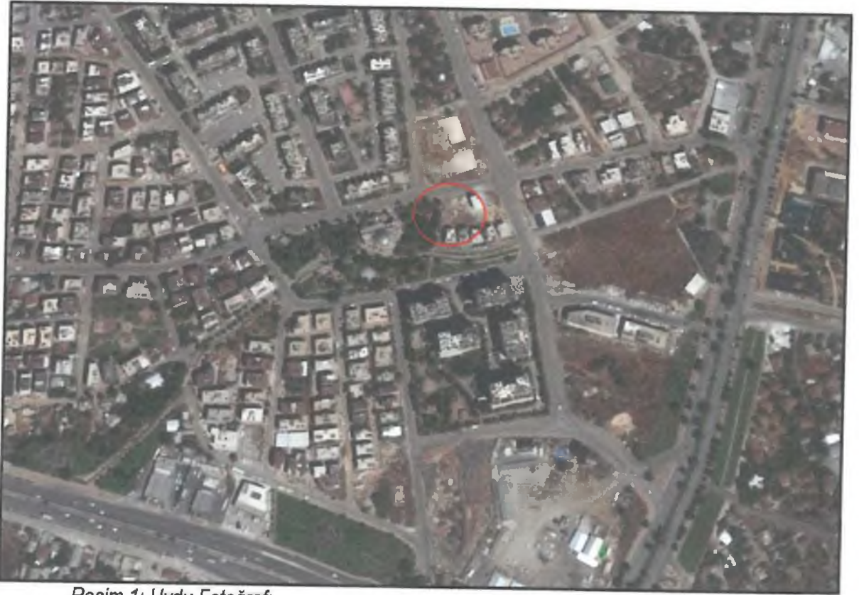
Resim 1: Uydu Fotoğrafı

Antalya, Büyükşehir, Kepez Belediyesi Düdenbaşı Mahallesi sınırları içerisinde, tapunun 10028 ada 1 ve 2 parsel numarasında kayıtlı taşınmazları üzerinde O25A-10C-1C numaralı paftaya giren 650 m 2 alanda (1 parsel 325 m 2 , 2 parsel 325 m 2 ) 1/1000 ölçekli Uygulama İmar Planı Değişikliği hazırlanmıştır.