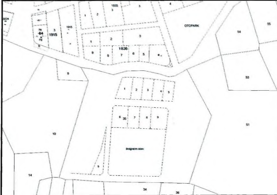
Şekil 2. Kadastral Durum

120 ada 35 ve 53 parseller, Serik İlçe merkezinde yer almaktadır.