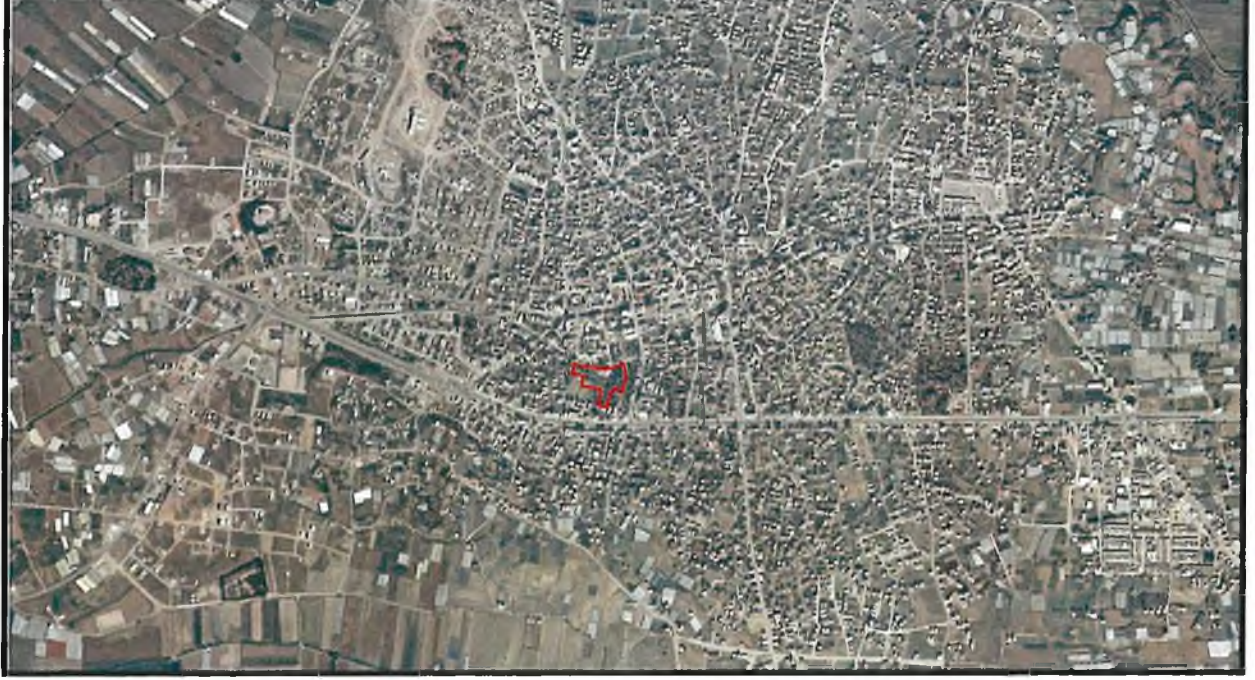
Şekil 1. Hava Fotoğrafi

Antalya İli Serik ilçesi sınırları içerisinde O26A-07C-2C ve O26A-08D-1D nolu 1/1000 ölçekli uygulama imar planı paftalarında yer almaktadır.