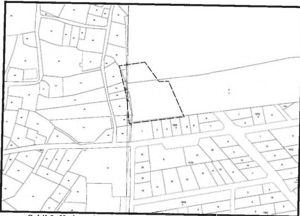
Şekil 2. Kadastral Durum

1571 ada 2 parsel, Serik İlçesi Kürüş Mahallesi sınırları içerisinde yer almaktadır.