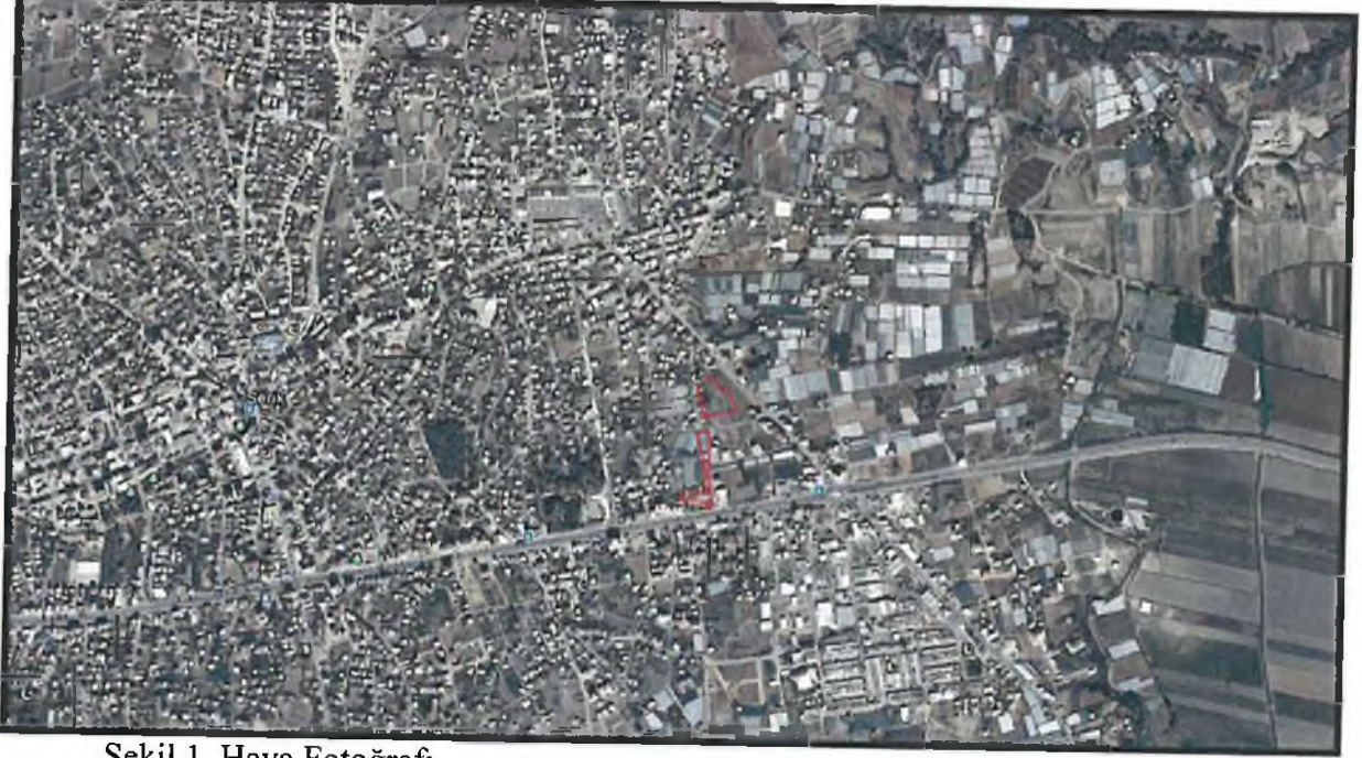
Şekil 1. Hava Fotoğrafi

Antalya İli Serik ilçesi sınırları içerisinde O26A-08D 1/5000 ölçekli nazım imar planı paftasında yer almaktadır.