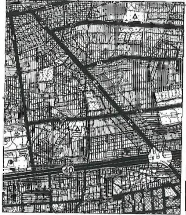
Şekil 4. 1/5000 ölçekli Nazım İmar Planı Değişikliği

ŞEHİRCİLİK BÖLÜMÜ ŞEHİR PLANLAMA VE İZLENİM BÖLÜMÜ ŞEHİR PLANLAMA VE İZLENİM BÖLÜMÜ ŞEHİR PLANLAMA VE İZLENİM BÖLÜMÜ ŞEHİR PLANLAMA VE İZLENİM BÖLÜMÜ ŞEHİR PLANLAMA VE İZLENİM BÖLÜMÜ ŞEHİR PLANLAMA VE İZLENİM BÖLÜMÜ ŞEHİR PLANLAMA VE İZLENİM BÖLÜMÜ ŞEHİR PLANLAMA VE İZLENİM BÖLÜMÜ ŞEHİR PLANLAMA VE İZLENİM BÖLÜMÜ