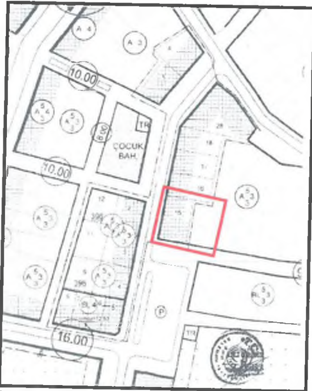
Plan 2 : 1/1000 ölçekli Uygulama İmar Planı örneği

1/1000 ölçekli Uygulama İmar Planında 14 parsel ayırık nizam 3 katlı konut alanı , 15 parsel yine ayırık nizam 3 katlı yol boyu ticaret-konut alanı olarak planlıdır.