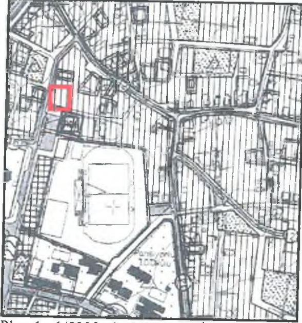
Plan 1 : 1/5000 ölçekli Nazım İmar Planı örneği

386 ada 14 ve 15 parseller , mevcut 1/5000 Ölçekli Nazım İmar Planında konut alanı olarak planlıdır.