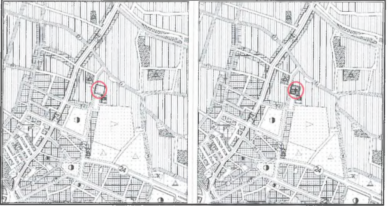
Plan1 : 1/5000 ölçekli mevcut ve öneri Nazım İmar Planı değişikliği görünümü (ölçeksiz)

Bu plan kapsamında , Mekânsal Planlar Yapım Yönetmeliği , Planlı alanlar Tip İmar Yönetmeliği ve ilgili Yönetmelik Hükümlerine uyulacaktır.