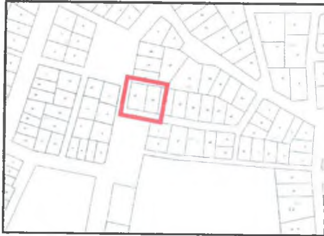
Resim 2: Kadastral Durum

Söz konusu parseller arsa niteliğinde olup , 14 parsel 485 m 2 , 15 parsel 591 m 2 büyüklüğündedir.