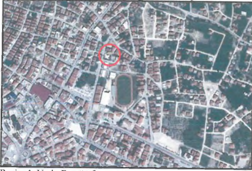
Resim 1: Uydu Fotoğrafi

Antalya İli , Büyükşehir (Korkuteli) Belediyesi Kiremitli Mahallesi sınırları içerisinde tapunun 386 ada 14 ve 15 parsel numarasında kayıtlı , toplam 1076 m 2 büyüklüğündeki taşınmazları konu alan , N24D-20-D nolu 1/5000 ölçekli Nazım İmar Planı paftasında yer alan 1/5000 ölçekli Nazım İmar Planı Değişikliği hazırlanmıştır.