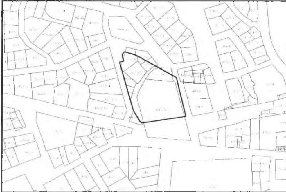
Şekil 3. Kadastral Durum.

Alana ilişkin kadastral durum aşağıdaki haritada verilmiştir.