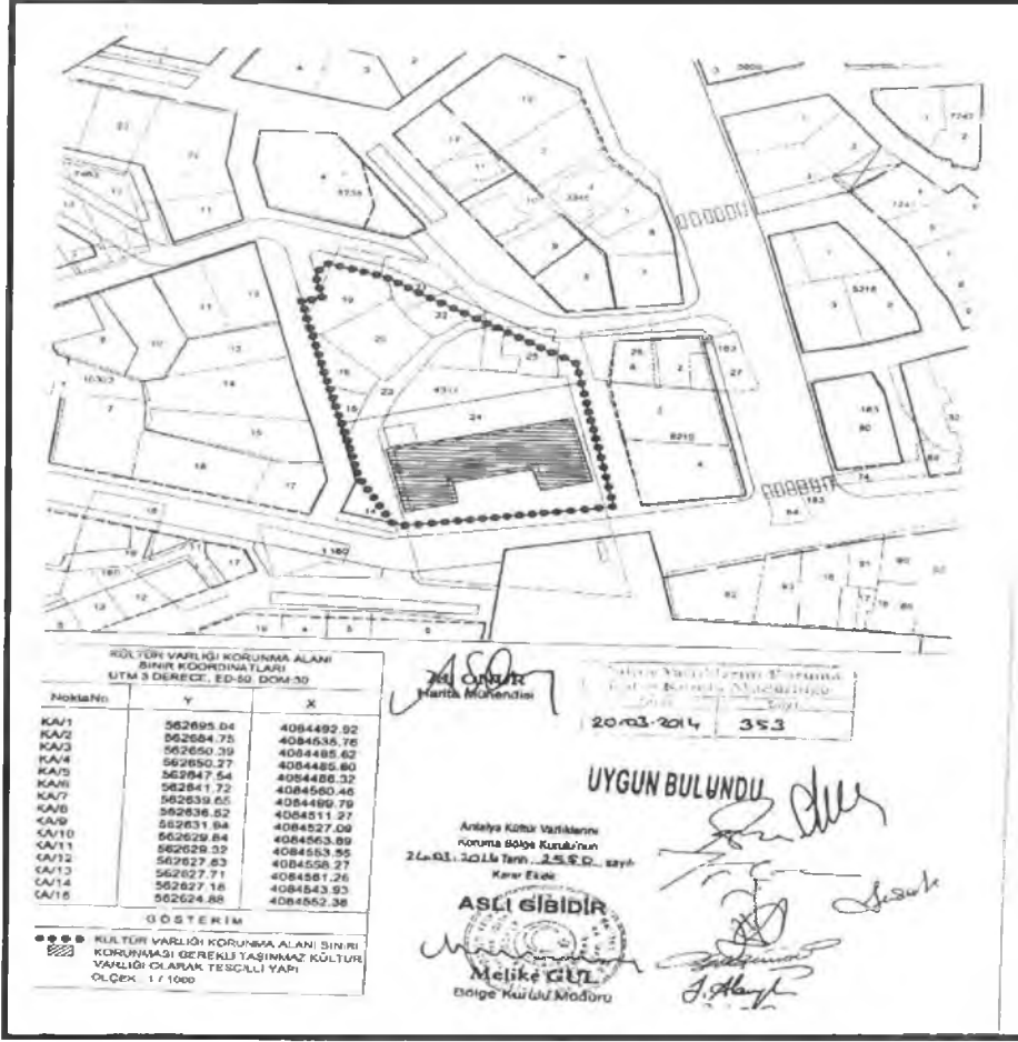
Şekil 2. 24.03.2014 tarih ve 2550 sayılı Koruma Bölge Kurulu Kararı eki harita.