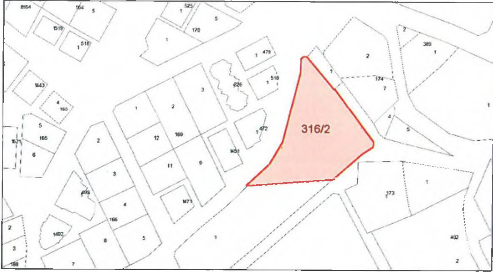
Şekil 2. Kadastral Durum