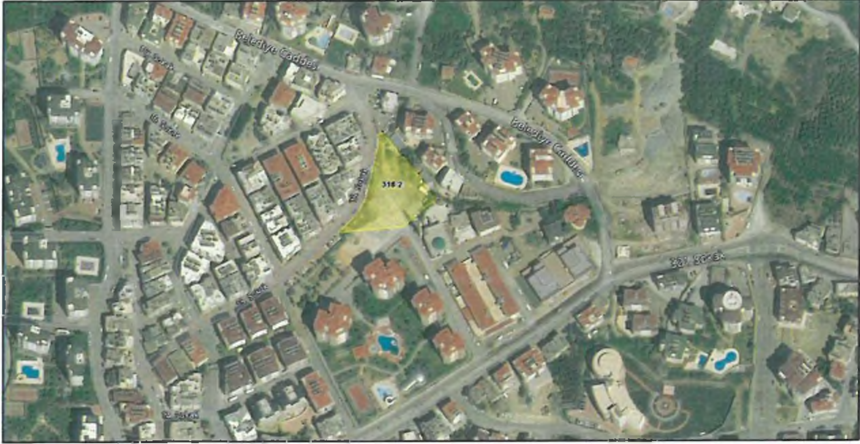
Şekil 1. Hava Fotoğrafı

Plan tadilat teklifine konu parsel Alanya İlçesi, Çikcilli Mahallesi sınırları içerisinde yer almaktadır. 316 ada 2 numaralı parsel Çikcilli Mahallesi sınırları içerisinde yer alan Durak Camisinin batısında O28D16C numaralı 1/5000 ölçekli hâlihazır haritada konumludur. Plan değişikliğine konu 316 ada 2 numaralı parsel tapu kayıtlarında 3129,05 m 2 olup plan değişikliği söz konusu parselin tamamını kapsamaktadır.