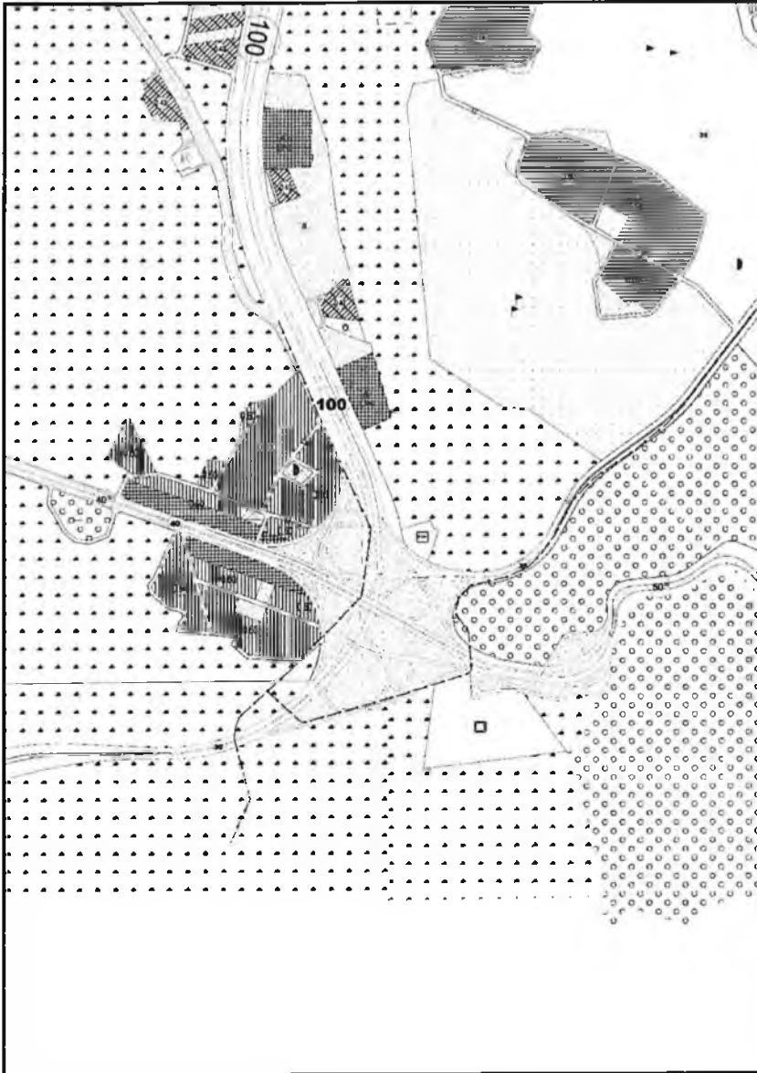
Şekil 3. Mevcut 1/5000 Ölçekli Nazım İmar Planı

Hazırlanan 1/5000 ölçekli Nazım İmar Planı Değişikliği ile Antalya-Burdur Karayolu üzerinde bulunan, Kepezüstü Köprülü Kavşağının revize edilen projesi doğrultusunda planda düzenleme yapılarak, kavşak içerisinde kalan sarnıç koruma alanı sınırı ve karayolu kamulaştırma sınırı imar planına işlenmiş, koruma alanına ilişkin "2863 sayılı Kültür ve Tabiat Varlıklarını Koruma Kanunu'nun 8. Maddesi Uyarınca Koruma Alanında Koruma Bölge Kurulu'nun İzni Alınmadan Uygulama Bulunulamaz." plan notu eklenmiştir.