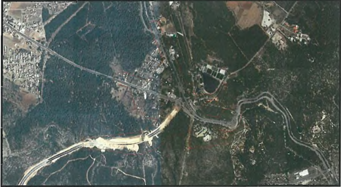
Şekil.1. Hava Fotoğrafı

Planlama alanı O25A-03C, O25A-03D, O25A-08A, O25A-08B nolu 1/5000 ölçekli Nazım İmar Planı paftaları içerisinde kalmaktadır.