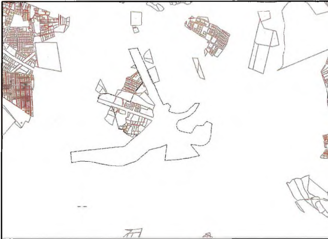
Şekil 2. Kadastral durum.

Planlama alanına ilişkin kadastral durum aşağıdaki haritada verilmiştir. Planlama alanının bir bölümünde imar uygulaması yapılmış olup tamamında uygulama yapılmamıştır. Köprülü kavşak projesi hazırlanan bahse konu alanda hâlihazırda geçici kavşak düzenlemesi yapılmış, olup kavşak çevresinde daha önceki imar planı kararları doğrultusunda oluşan akaryakıt istasyonu, ticari alanlar vb. bulunmakla beraber, imar planları öncesinde oluşan konutlarda bulunmaktadır.