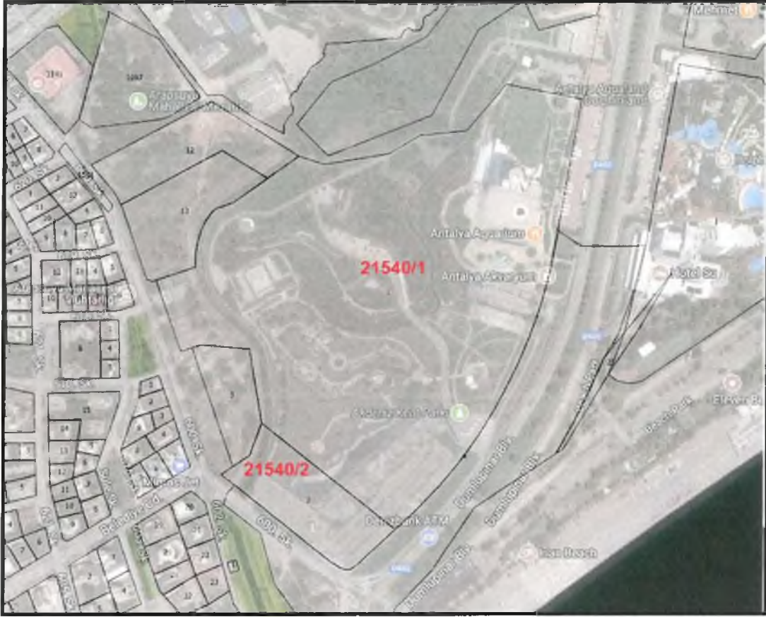
Resim 1: Planlama Alanı Hava Fotoğrafı

Planlama alanı O25A-14A-4C nolu 1/1000 ölçekli Uygulama İmar Planı paftası içerisinde kalmaktadır.