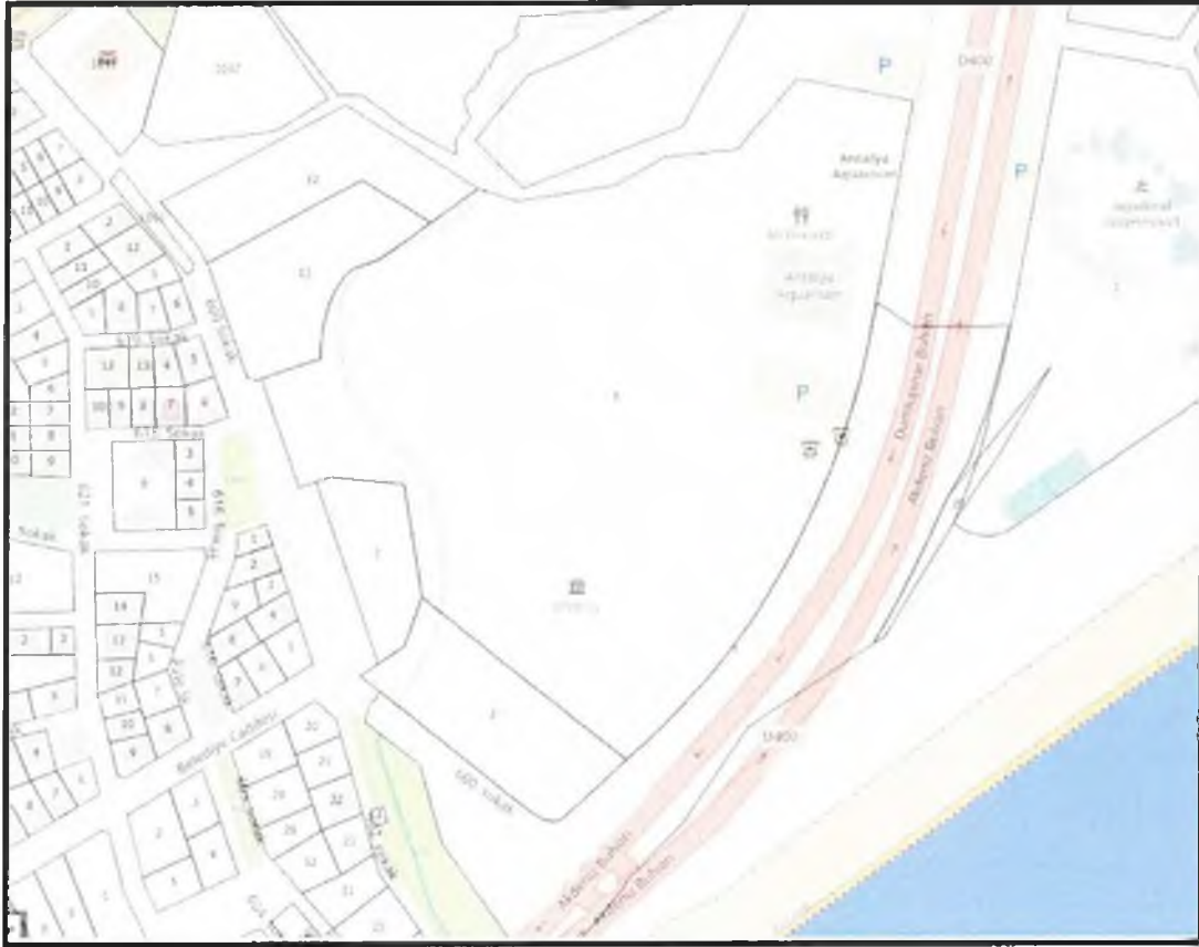
Resim 2. Kadastral Durum

Plan değişikliğine konu 21540 ada 1 ve 2 nolu parseller Büyükşehir Belediyesi mülkiyetinde olup parsellerin kadastral durumu aşağıdaki haritada verilmiştir.