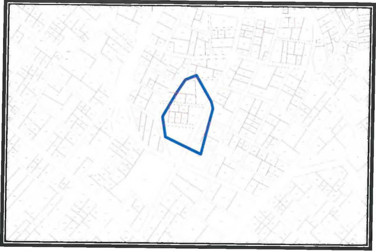
Şekil 3. Kadastral Durum.

Alana ilişkin kadastral durum aşağıdaki haritada verilmiştir.