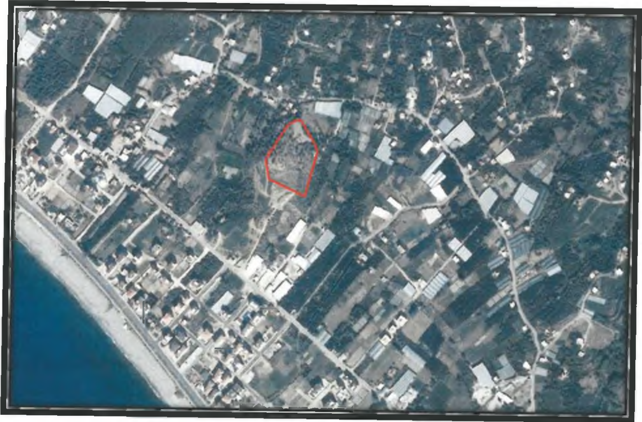
Şekil 1. Uydu fotoğrafı.

Planlama alanı; Antalya İli, Alanya İlçesi, Kestel Mahallesi sınırları içerisinde O28-d-22-c no'lu 1/5.000 ölçekli Nazım İmar Planı paftasında yer almaktadır. (Şekil 1)