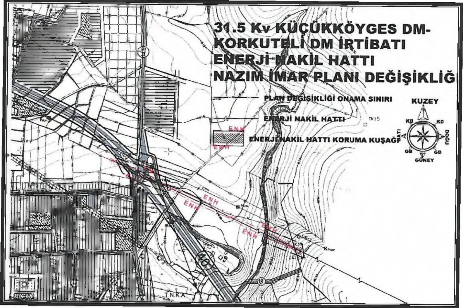
Şekil 2. Plan Örneği

Buna göre imar planı değişikliği önerisi hazırlanırken onaylanan projeye göre pylon yerleri, irtifa hakkı belirlenen enerji nakil hattı mevcut 1/5000 ölçekli nazım imar planına işlenmiştir.