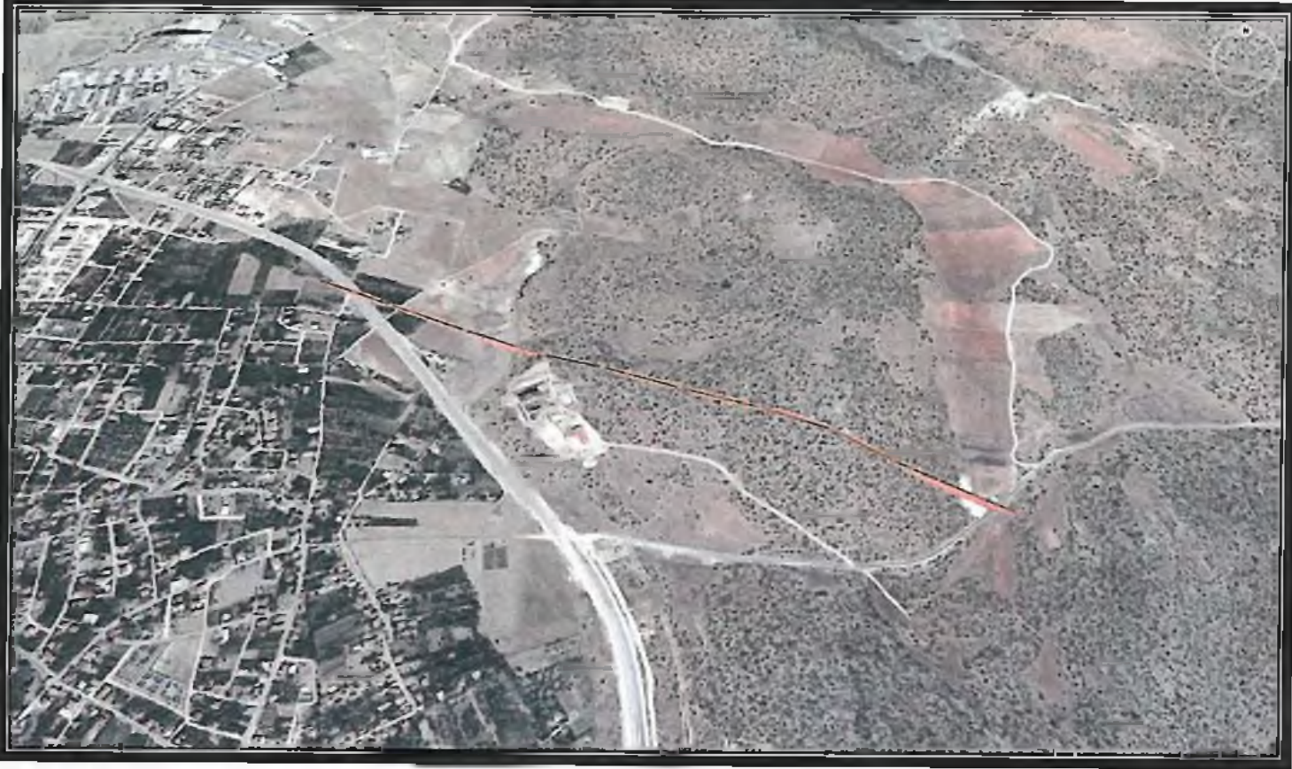
Şekil 1. Hava Fotoğrafi

1/5000 ölçekli Nazım İmar Plan Değişikliği önerisi Antalya İli, Korkuteli İlçesi, Küçükköy Mevkii sınırları içerisinde kalmakta olup bu bölgede yapılacak olan lisanslı elektrik üretim santrali için gerekli olan enerji nakil hattı ait güzergahında hazırlanmıştır. Bu güzergâh doğrultusunda söz konusu enerji nakil hattı Korkuteli İlçesi sınırları içerisinde mevcut planı bulunan alanın bir kısmından geçmektedir. Bu alan ise N24D20A imar plan paftasında yer almaktadır.