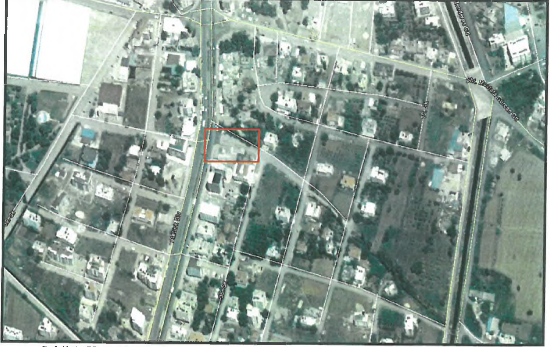
Şekil 1. Hava Fotoğrafı

Antalya İli Döşemealtı ilçesi sınırları içerisinde N25D-23D-1A nolu 1/1000 ölçekli uygulama imar planı paftasında yer almaktadır.