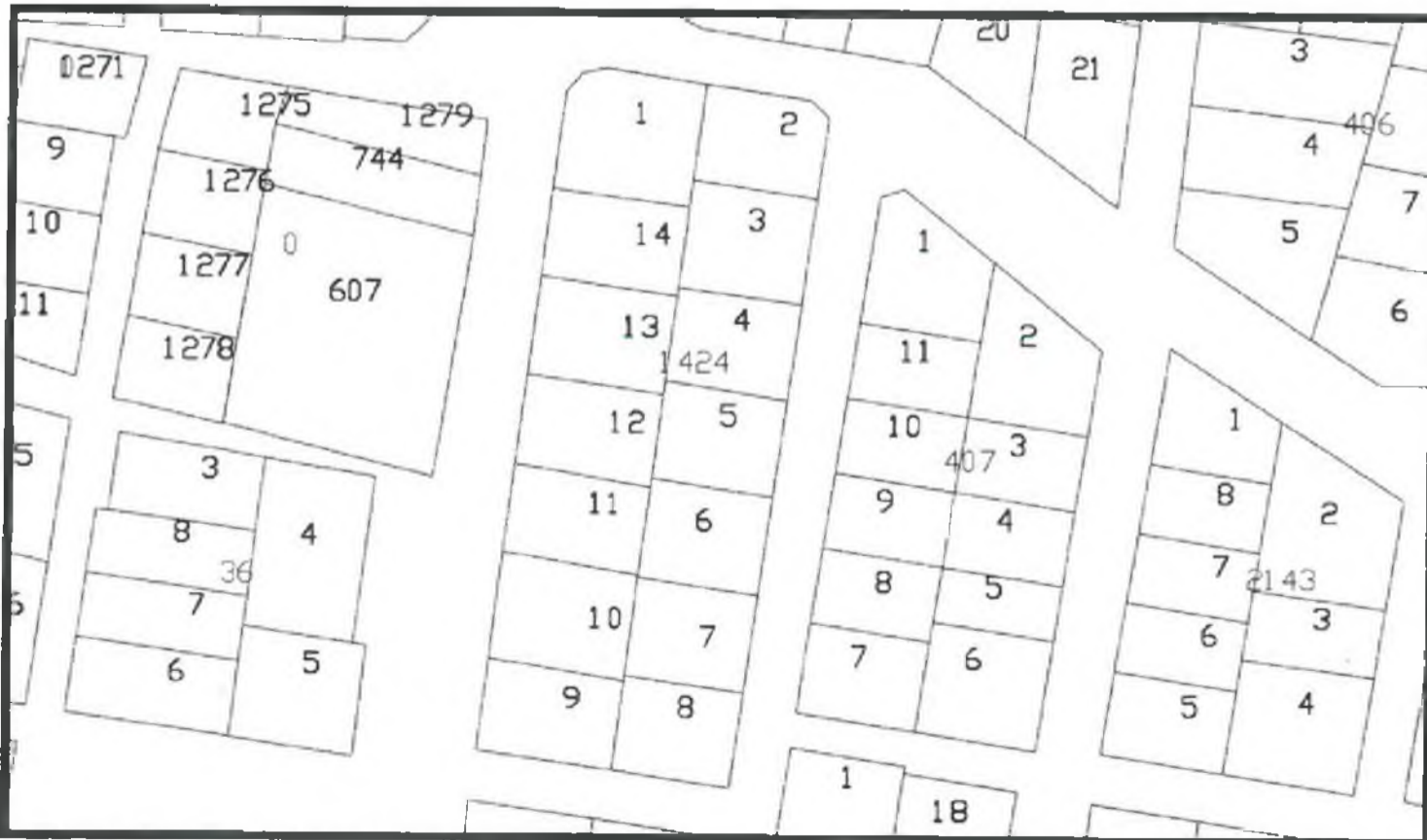
Şekil 2. Kadastral Durum

1424 ada 1 ve 2 parseller, Döşemealtı İlçesi Yeniköy tapulama sahası içerisinde yer almaktadır.