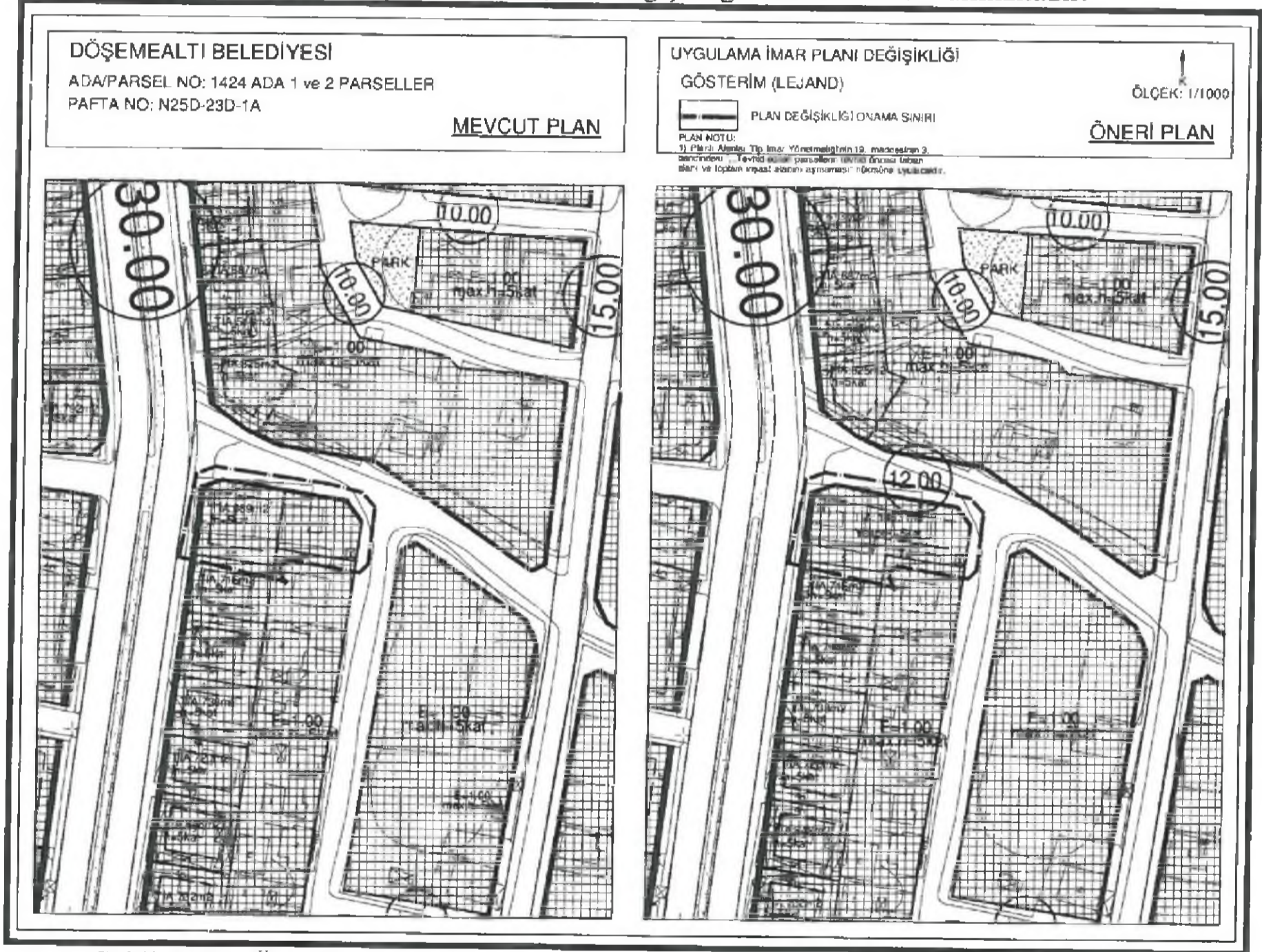
Şekil 3. Plan Örneği

Hazırlanan 1/1000 ölçekli uygulama imar planı değişikliği önerisi ekte sunulmaktadır.