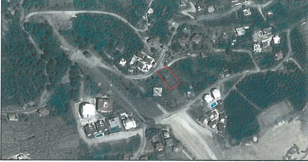
Şekil 1. Hava Fotoğrafi

Plan tadilat teklifine konu parsel Alanya İlçesi, Büyükhasbahçe Mahallesi sınırları içerisinde yer almaktadır. 2731 ada 2 numaralı parsel Mamadı Caddesi Tuğlu Sokak üzerinde O28D16D numaralı 1/5000 ölçekli hâlihazır haritada konumludur. Plan değişikliğine konu 2731 ada 2 numaralı parsel tapu kayıtlarında 878 m 2 'dir.