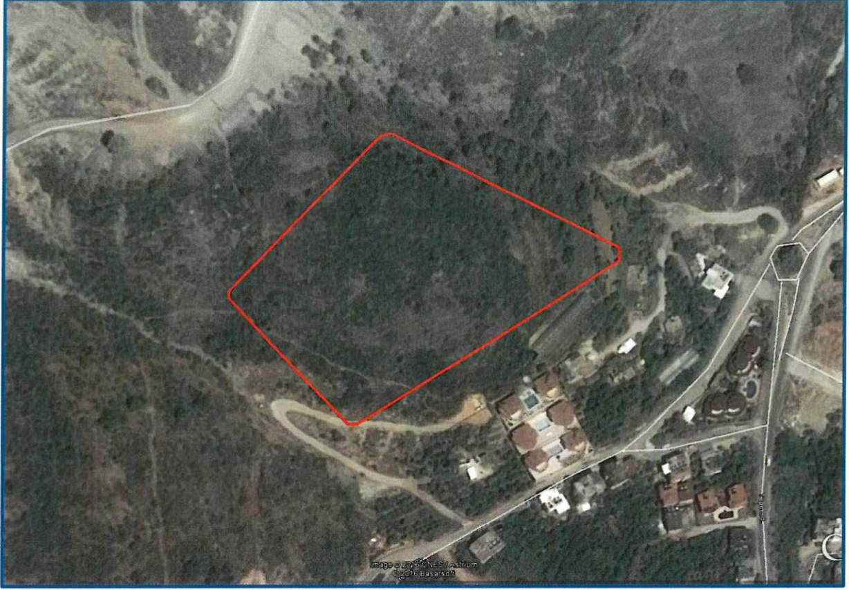
Şekil 2: Planlama Alanının ve Yakın Çevresi Mevcut Durumu

Planlama çalışmalarına konu olan 1549 ada 1 parsel güneyden kuzeye doğru yükselen bir topografik yapıya sahip olmakla birlikte taşınmazın en yüksek noktası kuzey bölümünde (287 m.), en düşük rakıma sahip olan noktası ise güney bölümünde (257 m.) bulunmaktadır.