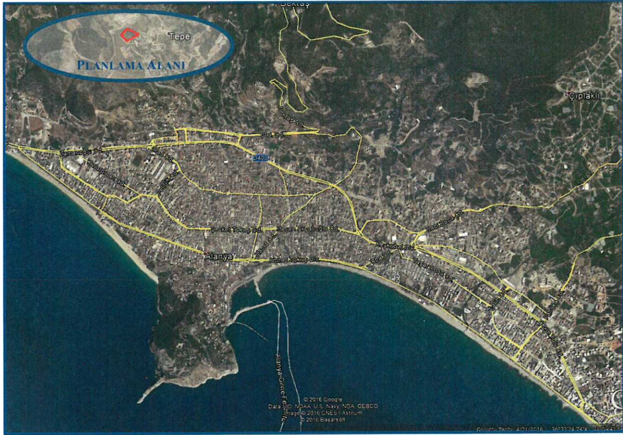
Şekil 1: Planlama Alanı Genel Konumu

Planlama alanının yakın çevresinde kısmen yapılaşmış alanlar bulunmakla birlikte bu yapıların bir bölümünün konut amaçlı bir bölümünün ise turizm amaçlı veya ikinci konut olarak kullanılan yapılar olduğu gözlemlenmektedir. Plan değişikliğine konu taşınmaz içerisinde herhangi bir yapılaşma bulunmamakta olup taşınmazın bitişiğinde ise yine mevcut yapılaşmalar bulunmaktadır.