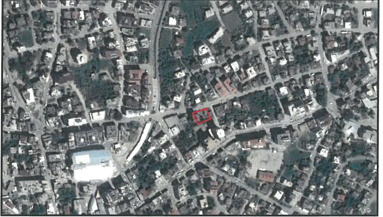
Şekil 1. Hava Fotoğrafi

Antalya İli Serik ilçesi sınırları içerisinde O26A-08D nolu 1/5000 ölçekli Nazım İmar Planı paftasında yer almaktadır.