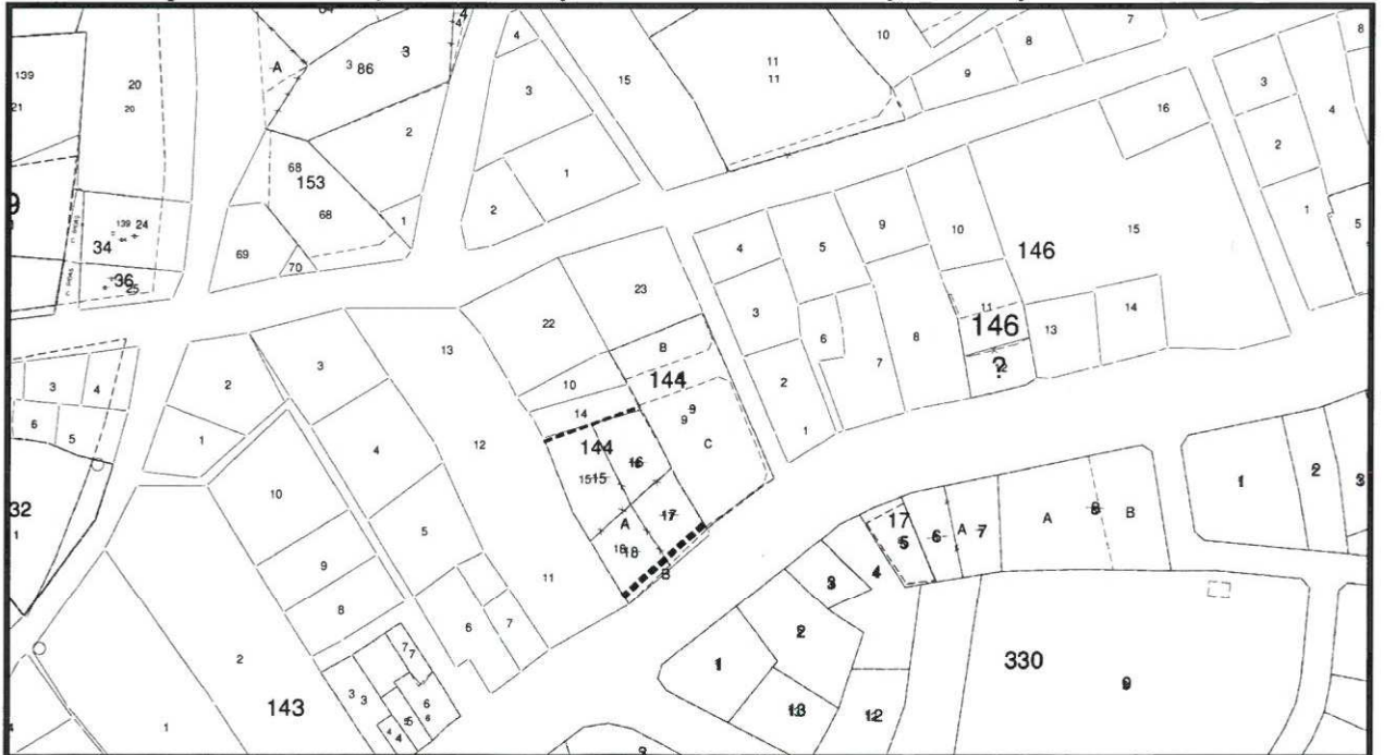
Şekil 2. Kadastral Durum

144 ada 23 parsel, Serik İlçesi Cumhuriyet Mahallesi sınırları içerisinde yer almaktadır.