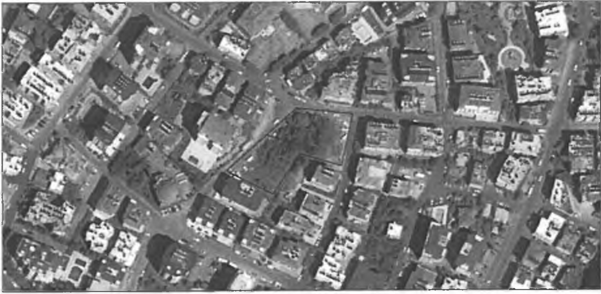
Şekil 1. Hava Fotoğrafi

Nazım imar planı değişikliği teklifi Antalya ili, Alanya ilçesi, Saray Mahallesi, 20L no'lu 1/5000 ölçekli hâlihazır pafta üzerinde yer alan, tapuda 677 ada 14 ve 15 numaralı taşınmazları kapsamaktadır. Taşınmazlar Yunus Emre Caddesi'nin yaklaşık 250 metre kuzeyinde Kazım Bulut Camisinin doğusunda konumlanmaktadır. 677 ada 14 parsel üzerinde 1. Ve 2. Derecede taşınmaz kültür varlığı beyanı mevcut olup, kargir ev ve arsası niteliğindeki parselin yüzölçümü 600.17 m 2 'dir. 677 ada 15 parsel 2528,83 m 2 yüzölçümlü arsa vasıflı olup, 317,89 m 2 'lik kısmında 1 ve 2. Derecede korunması gerekli kültür varlığı beyanı bulunmaktadır.