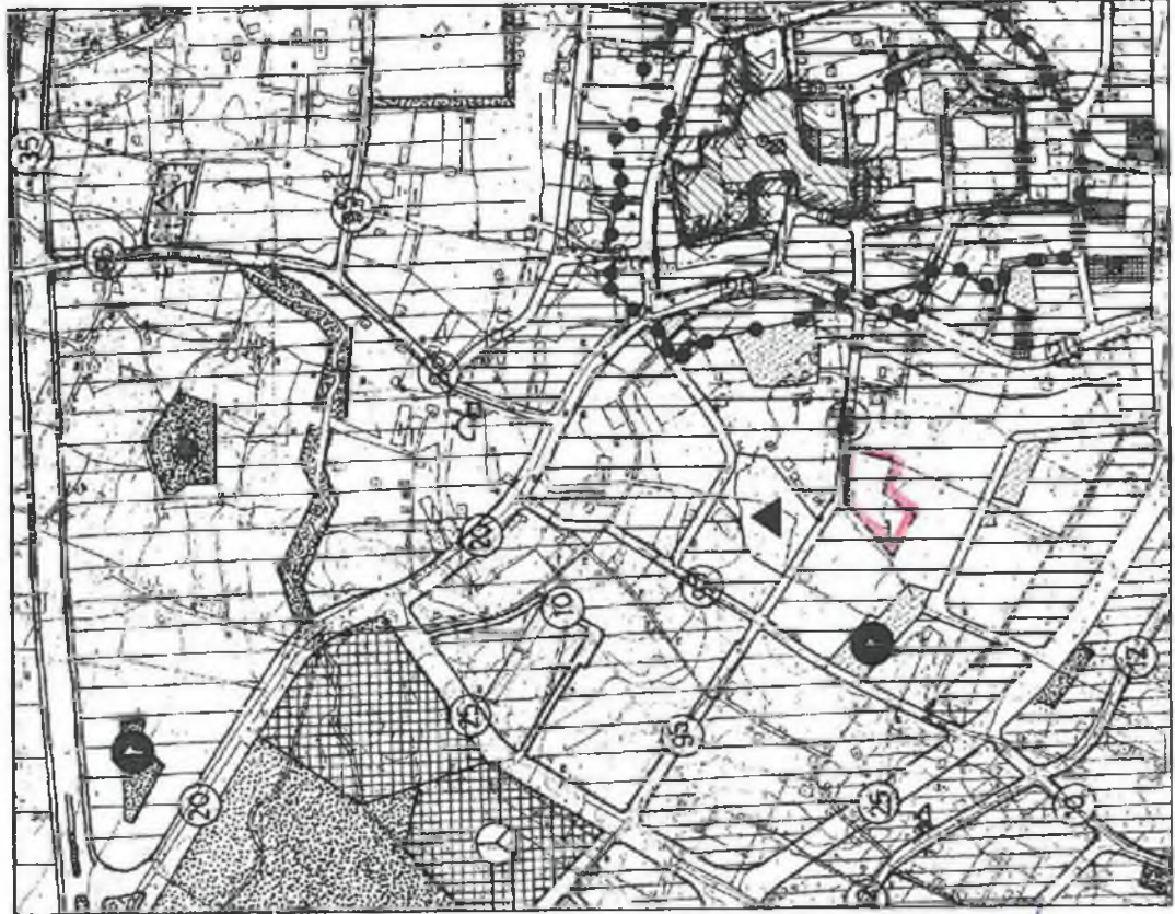
Şekil 3. Mevcut Nazım İmar Planı ve Nazım İmar Planı Değişikliği