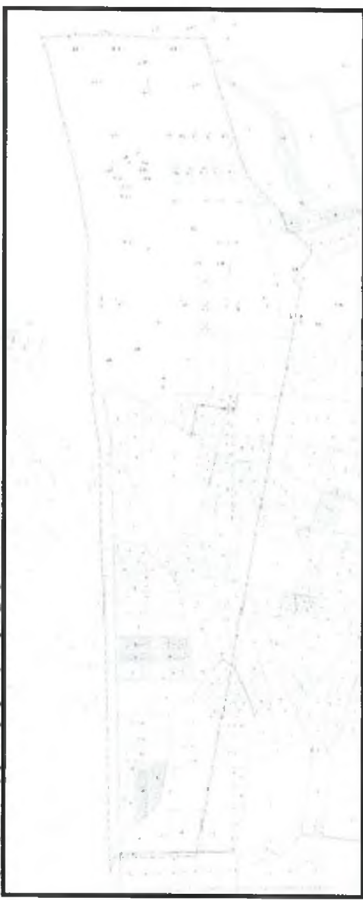
Şekil 2. Kadastral Durum

Planlama alanı, Serik İlçesi Karadayı Mahallesi içerisinde yer almaktadır. Planlama alanı mevcutta yapılaşmamış yeni yapılaşmaya geçecek alandır.