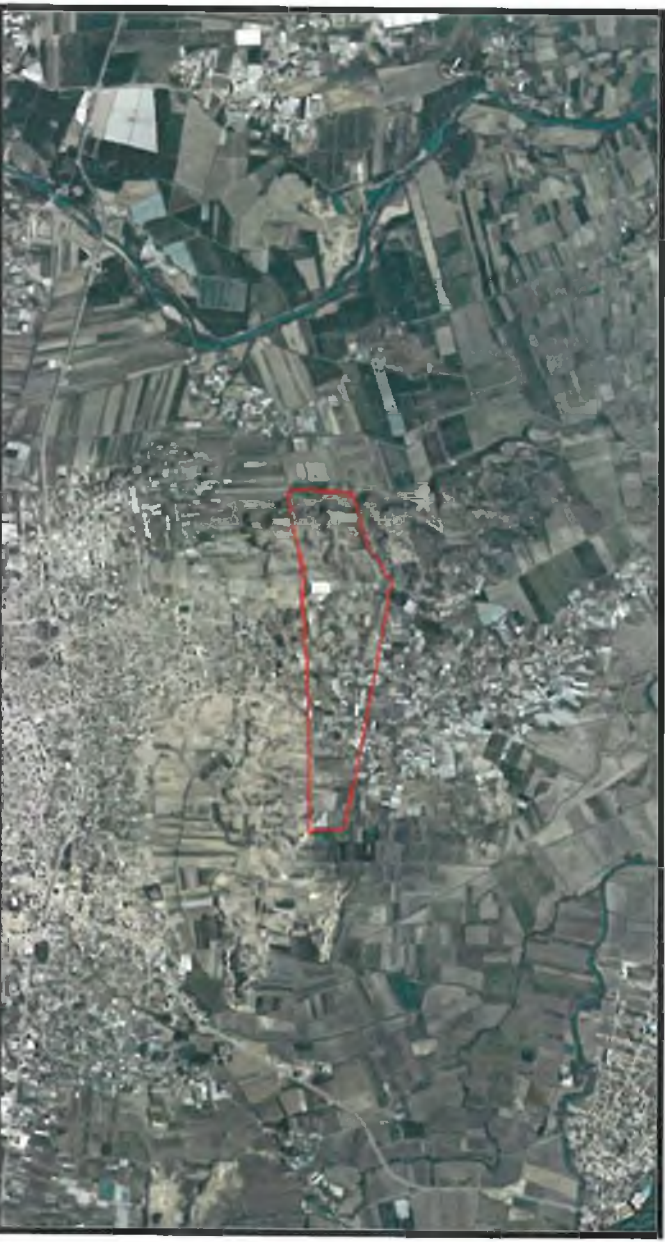
Şekil 1. Hava Fotoğrafı

Antalya İli Serik İlçesi sınırları içerisinde O26A-12B, O26A-13A ve O26A-13B nolu 1/5000 ölçekli uygulama imar planı paftalarında yer almaktadır.