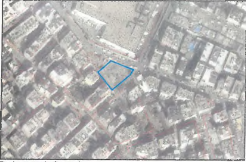
Resim 1: Uydu fotoğrafı

Antalya, Muratpaşa Belediyesi sınırları içerisinde Muratpaşa Mahallesinde bulunan 1385 m2 alanda 1/1000 ölçekli 20K-2D numaralı yerel koordinatlı paftaya giren 5287 ada 1 parselde Uygulama İmar Planı değişikliği hazırlanmıştır.