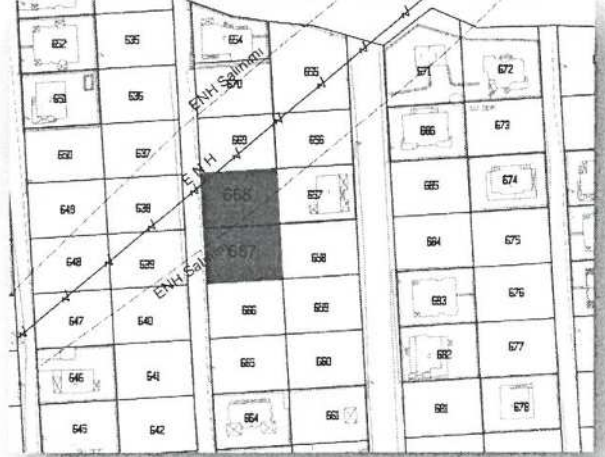
Halihazır ve Kadastral Durum