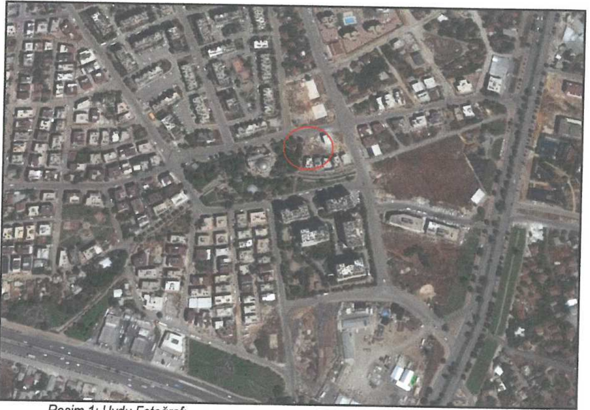
Resim 1: Uydu Fotoğrafı

Antalya, Büyükşehir, Kepez Belediyesi Düdenbaşı Mahallesi sınırları içerisinde, tapunun 10028 ada 1 ve 2 parsel numarasında kayıtlı taşınmazları üzerinde O25A-10C-1C numaralı paftaya giren 650 m 2 alanda (1 parsel 325 m 2 , 2 parsel 325 m 2 ) 1/1000 ölçekli Uygulama İmar Planı Değişikliği hazırlanmıştır.