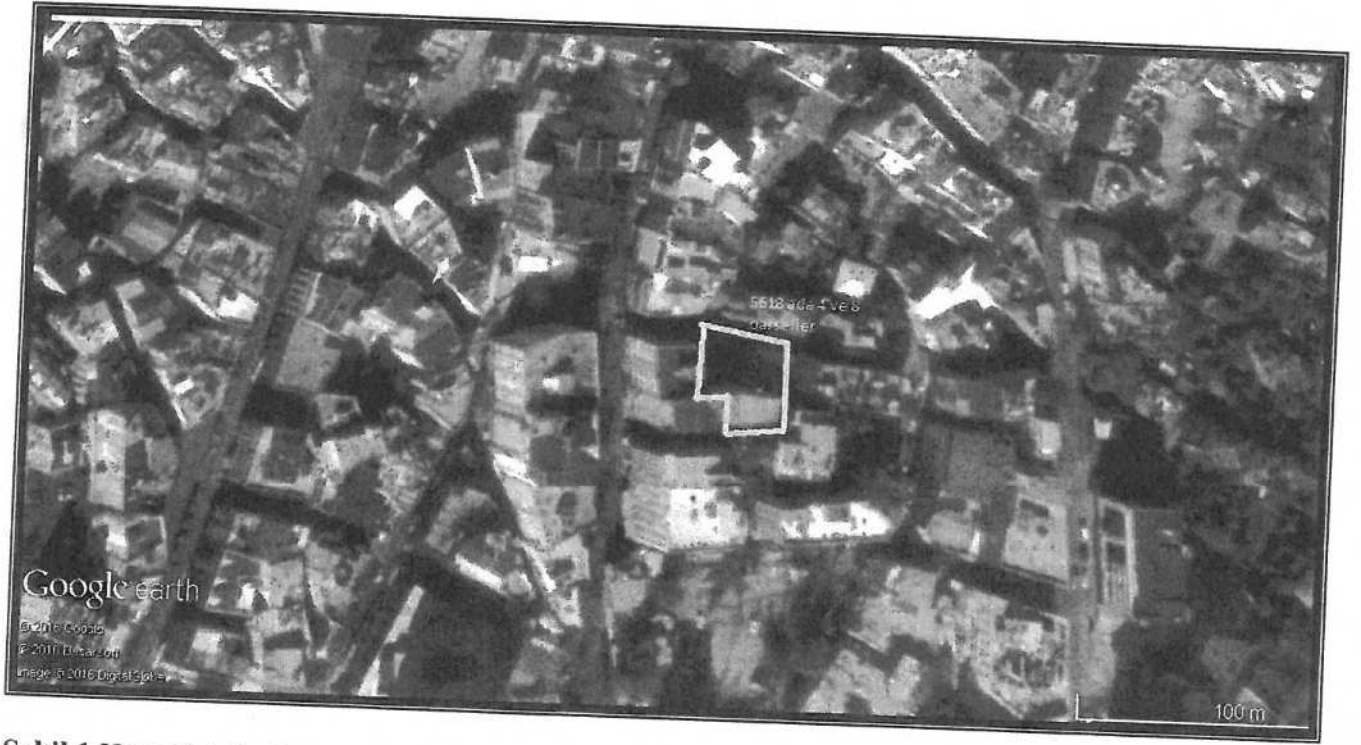
Şekil 1.Hava Fotoğrafı

Plan değişikliği önerisi olan 5618 ada 04 ve 08 parseller; Antalya ili, Muratpaşa İlçesi, 1/1000 ölçekli 20K-III d nolu İmar Planı paftasında bulunmaktadır.