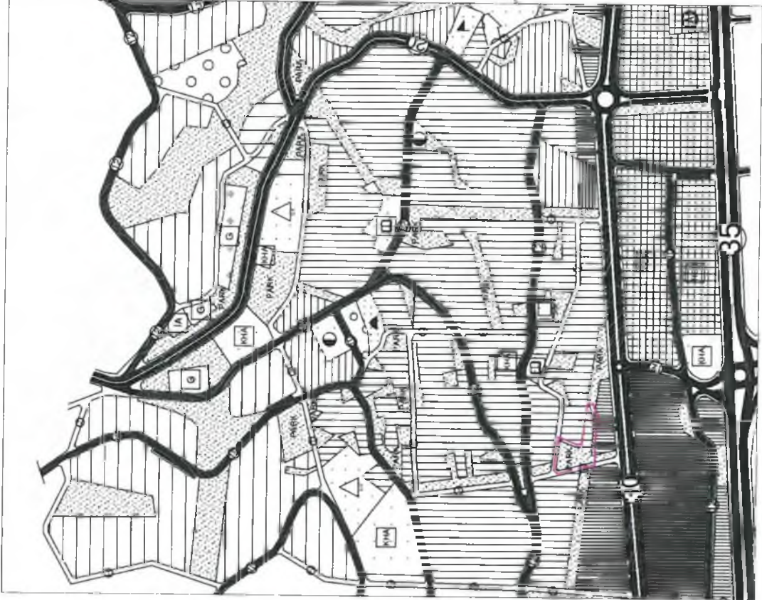
Şekil 3. Mevcut Nazım İmar Planı ve Nazım İmar Planı Değişikliği