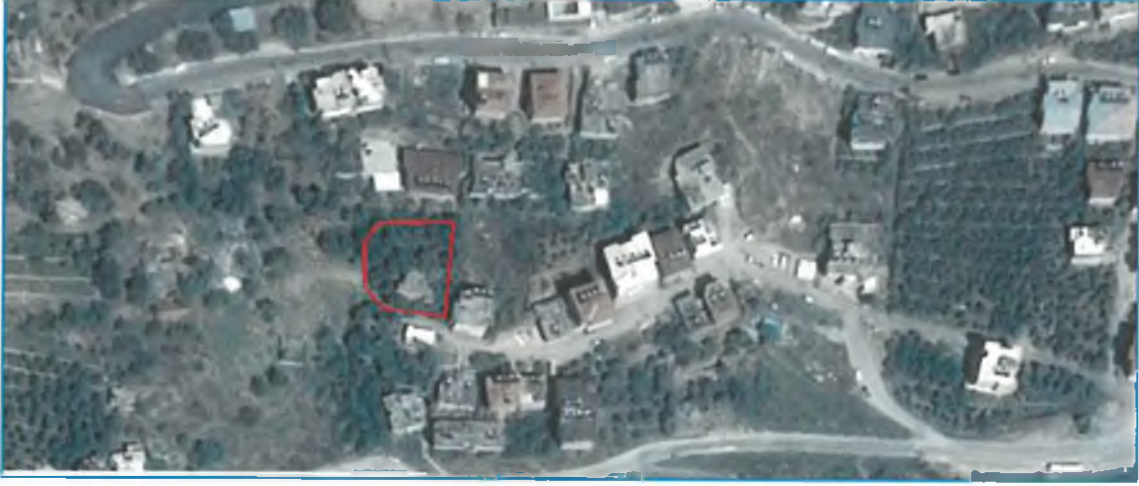
Şekil 1. Hava Fotoğrafi

Nazım imar planı değişikliği teklifi Antalya ili, Alanya ilçesi, Sugözü Mahallesi, O27C20C ve no'lu 1/5000 ölçekli halihazır pafta üzerinde yer alan, tapuda 1505 ada 1 numaralı taşınmazı ve söz konusu parselin güneyinde ve batısında yer alan park alanının bir kısmını kapsamaktadır. Taşınmaz D-400 Karayolu Telekom kavşağının 250 metre kuzeyinde yer almaktadır. Plan tadilatına konu 1505 ada 1 numaralı parselin yüz ölçümü 800 m 2 'dir.