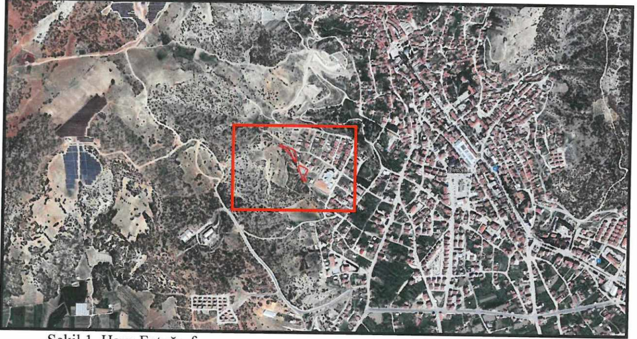
Şekil 1. Hava Fotoğrafi

Antalya İli Elmalı ilçesi Yenimahalle sınırları içerisinde O23C-04A-1C ve O23C-04A-4B nolu 1/1000 ölçekli paftalarda yer almaktadır.