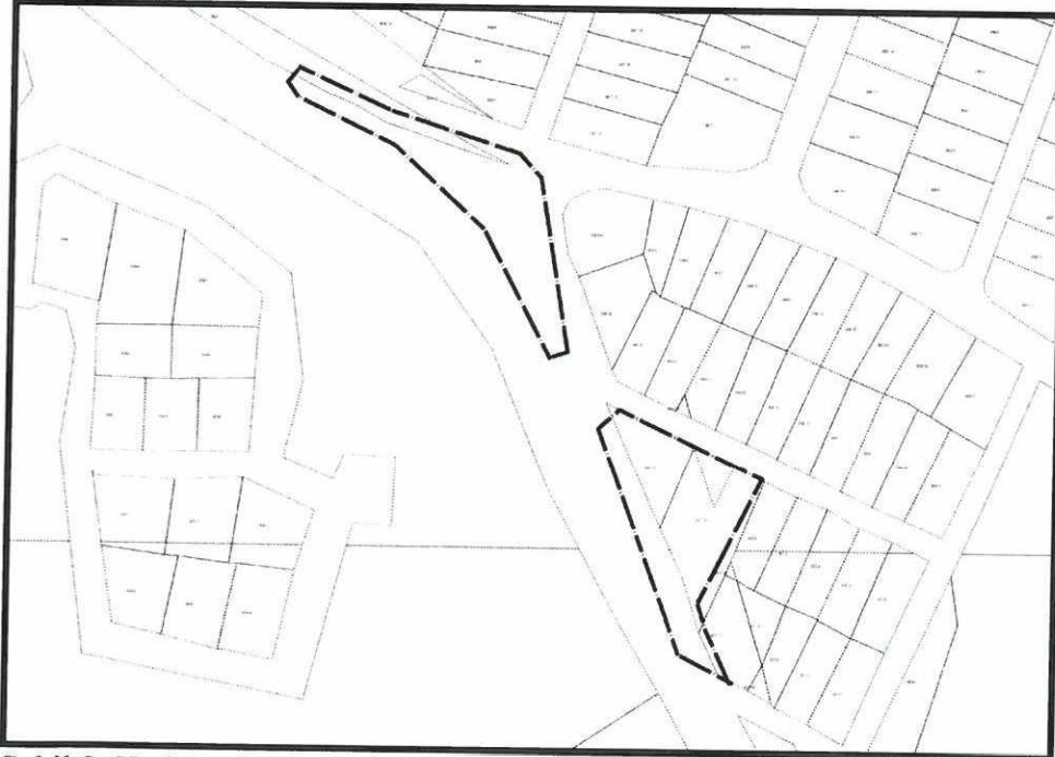
Şekil 2. Kadastral Durum

281 ada 175 parsel ile 307 ada 12, 13 ve 19 parseller, Elmalı İlçesi Karyağdı Mahallesi sınırları içerisinde yer almaktadır.