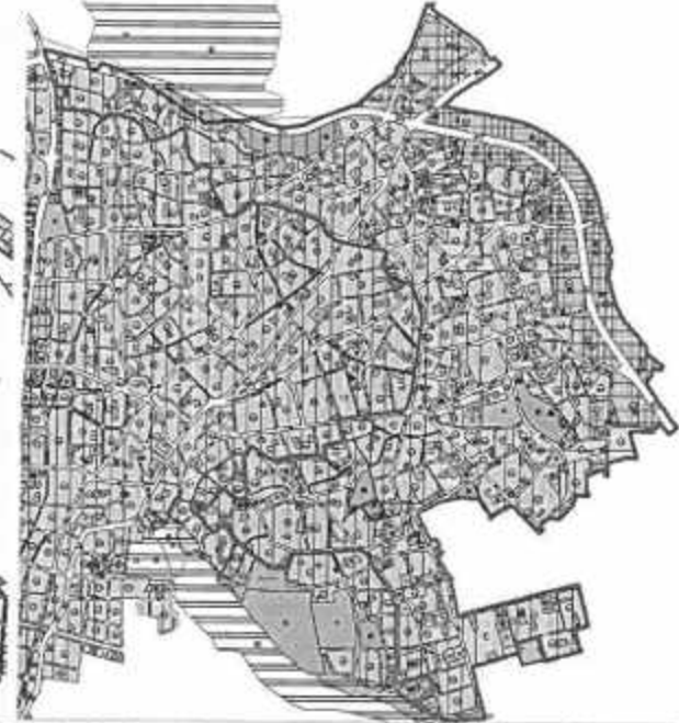
Resim 2: Onaylı Bütüncül 1/5000 Ölç. Naz. İm. Planı