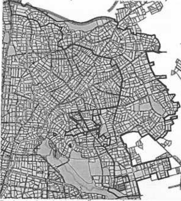
Resim 1: Onaylı 1/1000 Ölç. Uyg. İmar Planı

Plan revizyonuna konu alan; Antalya Merkez, Kepez İlçesi, Varsak Bölgesi, Altıyayak, Varsak Menderes, Varsak Esentepe, Şelale, Zeytinlik ve Gaziler Mahallelerinde daha önce hazırlanan ve onaylanıp askıya çıkan 1/1000 ölçekli uygulama imar planına (Bkz: Resim 1) askı süresi içinde yapılan itirazların kısmen kabulüne yönelik olarak 1/5000 ölçekli nazım imar planı revizyonu hazırlanan alanları kapsamaktadır (Bkz: Resim: 1, 2 ve 3).