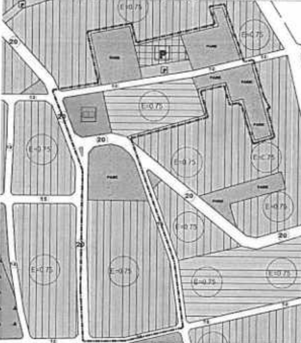
Resim 3: Mevcut 1/5000 Ölç. Nazım İmar Planı