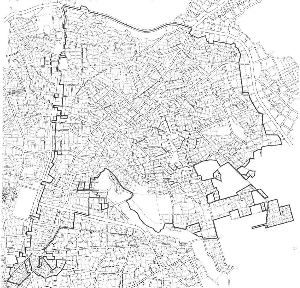
Resim 2: Plan Notu Eklenen Alanlar

Plan notu eklenen alan; Antalya İli, Kepez İlçesi, Varsak Doğu Bölgesindeki aşağıda sınırları belirtilmiş planlı alanları kapsamaktadır (Bkz: Resim 1).