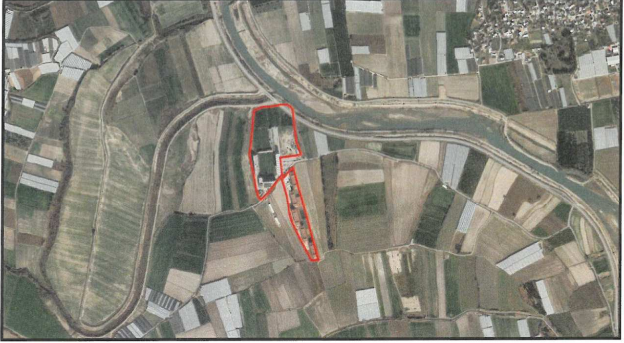
Şekil.1 Hava Fotoğrafi

Planlama Alanı Antalya İli, Aksu Belediyesi Kemerağzı Mahallesi sınırları içerisinde kalmaktadır. (Şekil1).