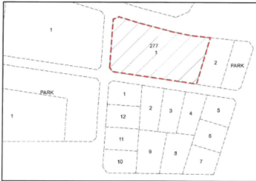
Şekil 2. Taşınmaz ve çevresinin mülkiyet sınırlarını gösterir kroki

Plan değişiklik teklifine konu bölgede imar uygulaması tamamlanmıştır. Arsa vasıflı taşınmaz içerisinde tek katlı çelik depo yapısı bulunmaktadır.