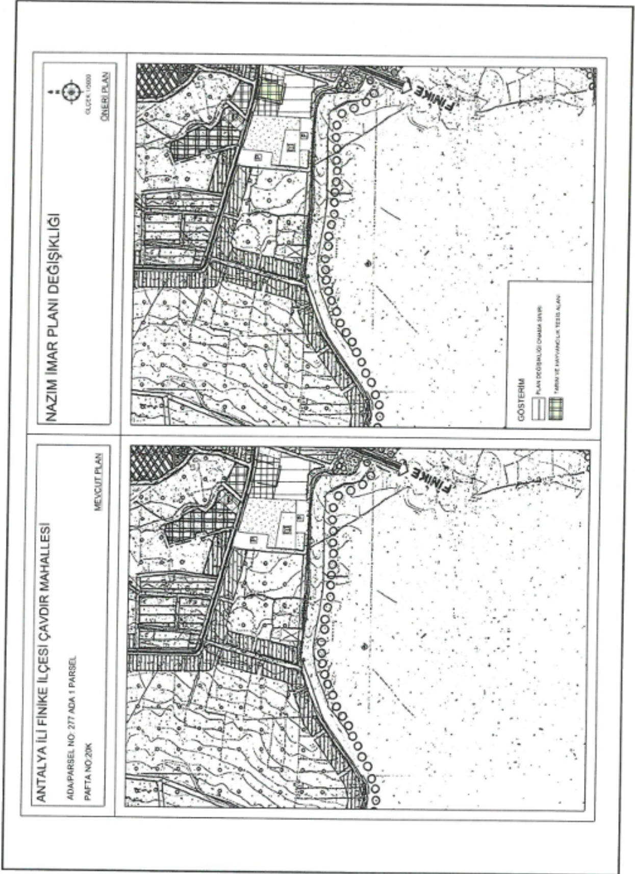
Şekil 6. Mevcut ve öneri nazım imar planı değişikliği