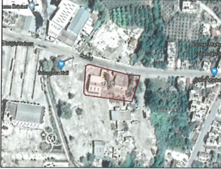
Şekil 1. Planlama konusu alanı ve yakın çevresini gösterir uydu görüntüsü

Nazım imar planı değişikliği teklifi Antalya İli, Finike İlçesi, Çavdır Mahallesi sınırları içerisinde yer alan, 3.250,54 m 2 yüz ölçümlü, 227 ada 1 parsel numaralı taşınmazın 1.625,33 m 2 'lik kısmını kapsamaktadır. Parsel Hal Caddesi üzerinde olup Turunçova Düğün Salonu'nun 150 m doğusunda, eski Turunçova Yaş Sebze ve Meyve Hali'nin yerinde bulunmaktadır.