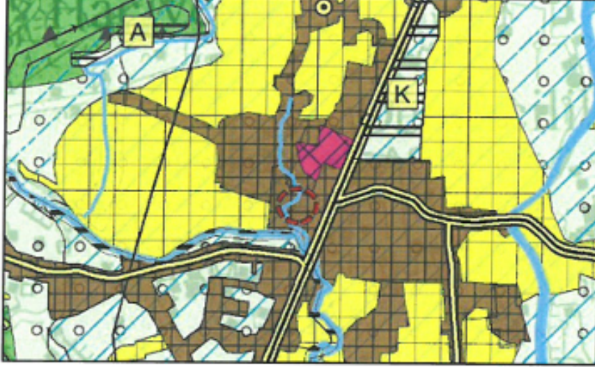
Şekil 3: Plan Değişikliğine konu alanın "Antalya-Burdur-Isparta Planlama Bölgesi 1/100.000 Ölçekli Çevre Düzeni Planı"ndaki Yeri

Plan değişikliğine konu taşınmazın bulunduğu bölge, Çevre ve Şehircilik Bakanlığı'nca onanlı Antalya-Burdur-Isparta Planlama Bölgesi 1/100.000 Ölçekli Çevre Düzeni Planı'nda "Kentsel Yerleşik Alan"da kalmaktadır.