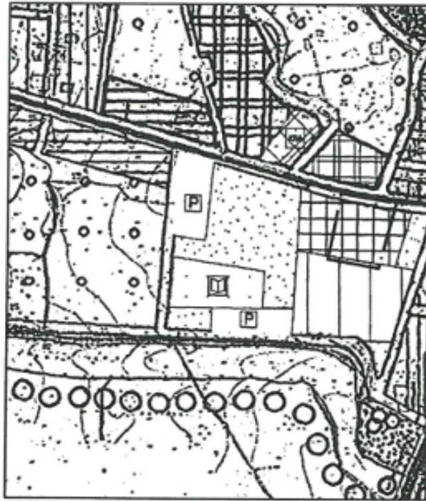
Şekil 4: Plan değişikliğine konu alanın 1/5.000 Ölçekli Nazım İmar Planı'ndaki yeri

Yürürlükteki 1/5.000 Ölçekli Nazım İmar Planı'nda 227 ada 1 parsel "Ticaret Alanı" olarak planlanmıştır. Uygulama imar planında yapılaşma koşulları E: 2,00 ve en fazla 5 kattır. Taşınmazın kuzeyinde 12 m kesit genişliğinde taşıt yolu, güneyinde ve batısında 7 m kesit genişliğinde yaya yolu, doğusundaki komşu parselde ise yine ticaret alanı öngörülmüştür.