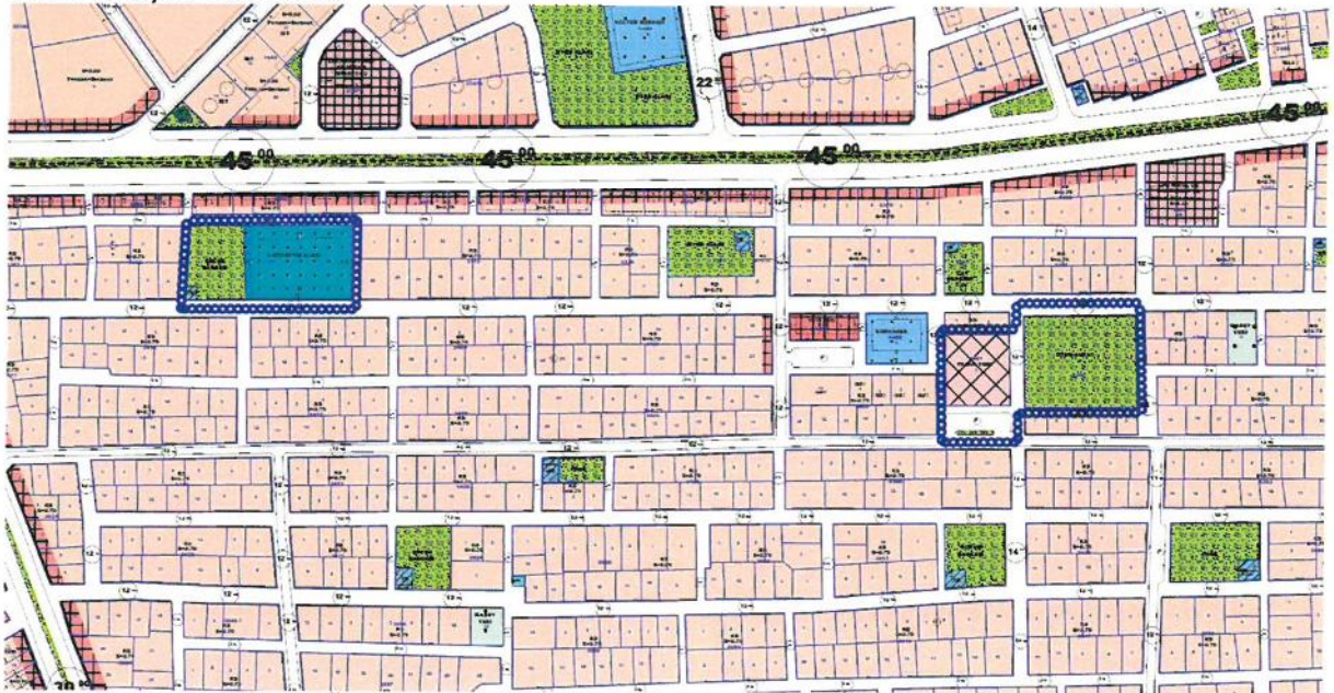
Resim 2: Mevcut 1/1000 Ölçekli Uygulama İmar Planı

Karşıyaka Mahallesinde artan nüfusun ihtyacını karşılamak için İlkokul Alanına ihtiyaç duyulmaktadır. 5371 adadaki ilkokul alanında mülkiyet sorunu bulunduğundan burada yapılamamaktadır. Bu nedenle mahalleye hizmet etmek üzere; mülkiyet sorunlarını çözebilmek ve daha büyük bir ilkokul alanı oluşturabilmek amacıyla bir plan revizyonu yapılması gerekmektedir. Yapılan etüdler sonucunda 5397 adadaki Pazar alanı ve güneyindeki otoparkın ve 5401 adadaki oyun alanının da dahil edilmesiyle bu alanların yeniden düzenlenerek mülkiyet sorunu olmayan ve daha geniş bir ilkokul alanı oluşturulabileceği görülmüştür. Ancak bu değişikliğin yapılabilmesi için öncelikle 1/5000