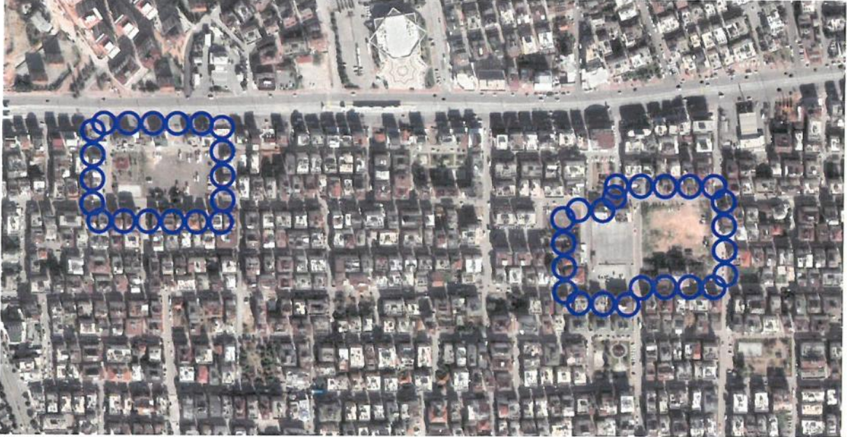
Resim 1: Uydu Görüntüsü

Plan revizyonu; Antalya İli, Kepez İlçesi, Karşıyaka Mahallesi, 21-K nolu 1/5000 ölçekli nazım imar planı paftasında, 5371 adadaki ilkokul ve çocuk bahçesi alanı, 5401 ada 3 nolu parseldeki Pazar alanı ile güneyindeki otopark alanı ve 5397 ada 6 nolu parseldeki oyun alanını kapsamaktadır (Bkz: Resim 1, 2 ve 3).