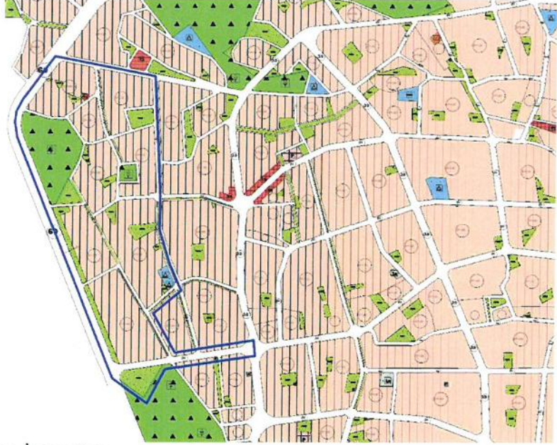
Resim 3: Mevcut 1/5000 Ölçekli Nazım İmar Planı

taleplerinin karşılanması düşünülmektedir. Bunun için öncelikle 1/5000 ölçekli nazım imar planı revizyonu hazırlanması gerekmektedir.