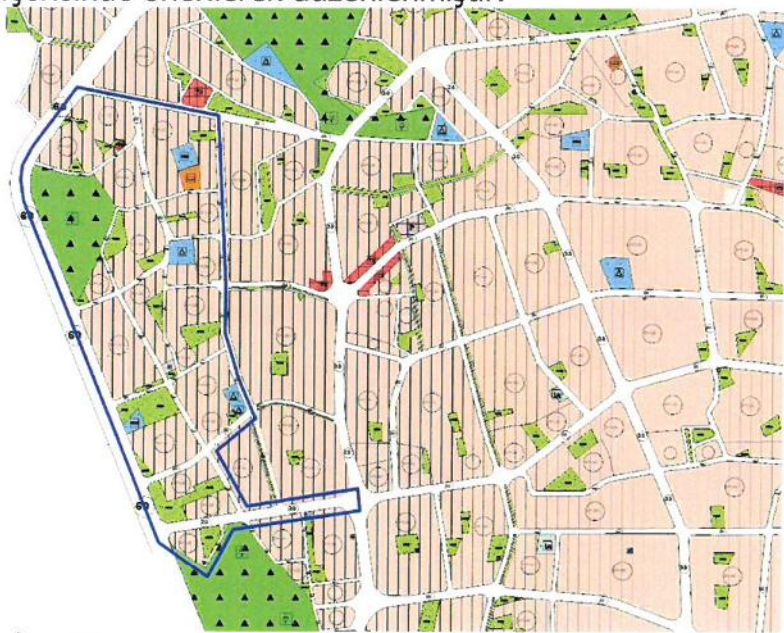
Resim 4: Öneri 1/5000 Ölçekli Nazım İmar Planı

Tüm bu düzenlemeler sonucunda zayıt oranı %44.88'e çekilerek imar uygulamasının önü açılmış, nüfus yeni eklenen konut alanları ile 2162 kişiden 484 kişi artarak 2646 kişi olmuştur (Bkz: Tablo 1). Artan nüfusun ihtiyacı olan yeşil alanlar ile donatı alanları planlama alanı içerisinde önerilerek düzenlenmiştir.