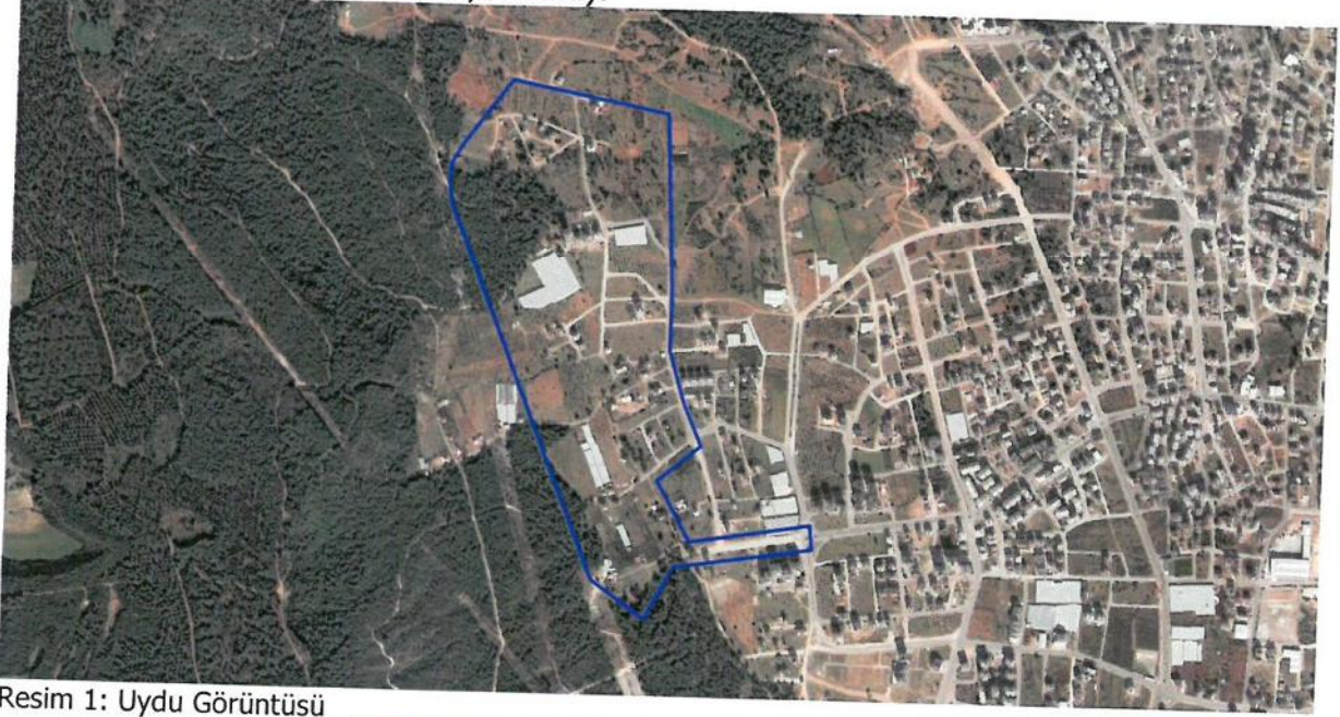
Resim 1: Uydu Görüntüsü

Plan revizyonu; Antalya İli, Kepez İlçesi, Aydoğmuş Mahallesi, O25-A-04-B ve O25-A-04-C nolu 1/5000 ölçekli nazım imar planı paftalarında, mahallenin orman ve batı çevre yoluna cephe olan kısımlardaki konut, orman ve park alanlarını kapsamaktadır (Bkz: Resim 1, 2 ve 3).