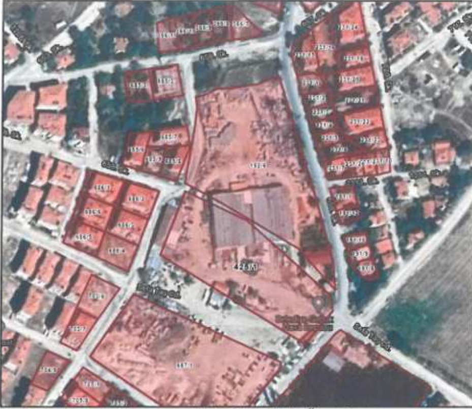
Resim 2: Kadastral Durum ve Uydu Görüntüsü (Ölçeksiz)