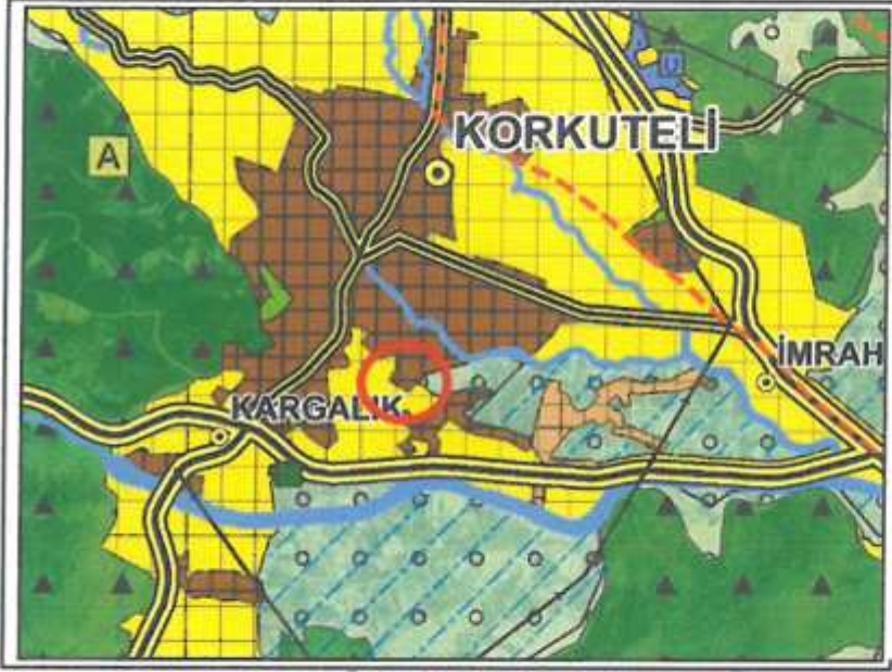
Plan 1: Onaylı 1/100.000 Ölçekli Çevre Düzeni Planı (Ölçeksiz)