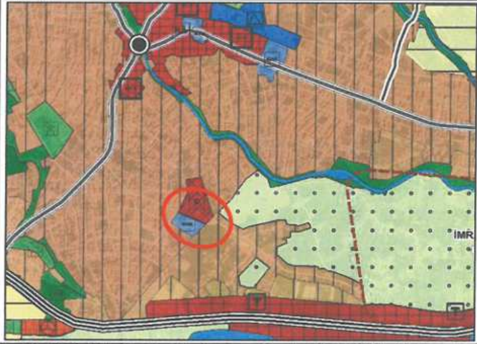
Plan 2: Antalya Büyükşehir Belediyesince Onaylı 1/25.000 Ölçekli Nazım İmar Planı (Ölçeksiz)

Planlama Alanı sınırları dahilinde hazırlanan 1/25.000 ölçekli Nazım İmar Planı Değişikliği Antalya Büyükşehir Belediyesi Meclisi tarafından 10.09.2019 tarihinde revize edilen plan onaylanmıştır. Onaylanan 1/25.000 ölçekli Nazım İmar Planında plan değişikliği alanı Depolama Alanı olarak planlıdır.