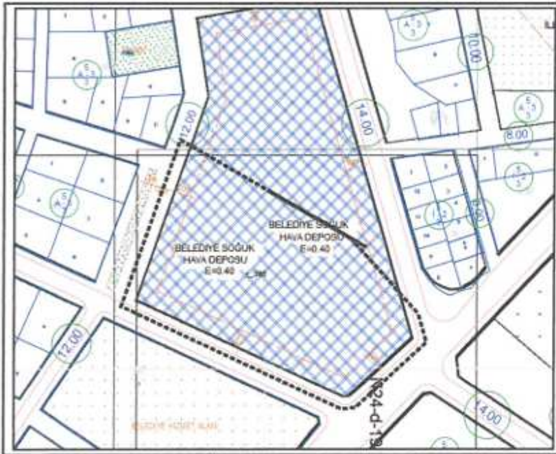
Plan 4: Mevcut 1/1.000 Ölçekli Uygulama İmar Planı (Ölçeksiz)

Antalya İli, Korkuteli İlçesi, Kargalık Mahallesi, 425 Ada 1 Parsel ve Tescil Harici Alan , mevcut 1/1000 ölçekli Uygulama İmar Planında Korkuteli Belediyesine ait Depolama Alanı olarak planlı durumdadır.