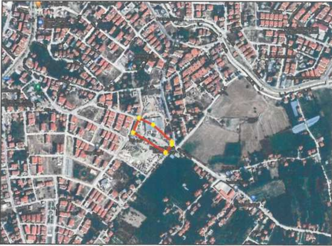
Resim 1: Uydu Fotoğrafı (Ölçeksiz)

Antalya ili , Büyükşehir Belediyesi , Korkuteli İlçesi , Kargalık Mahallesi sınırları içinde Korkuteli Belediyesi adına kayıtlı 425 ada 1 parsel (7729.6 m 2 ) ve bu alanın güneyindeki 2724.7 m 2 büyüklüğündeki tescil harici alanı kapsayan , N24-D-19-C ve N24-D-20-D numaralı paftalara giren 1/5000 ölçekli Nazım İmar Planı Değişikliği hazırlanmıştır.