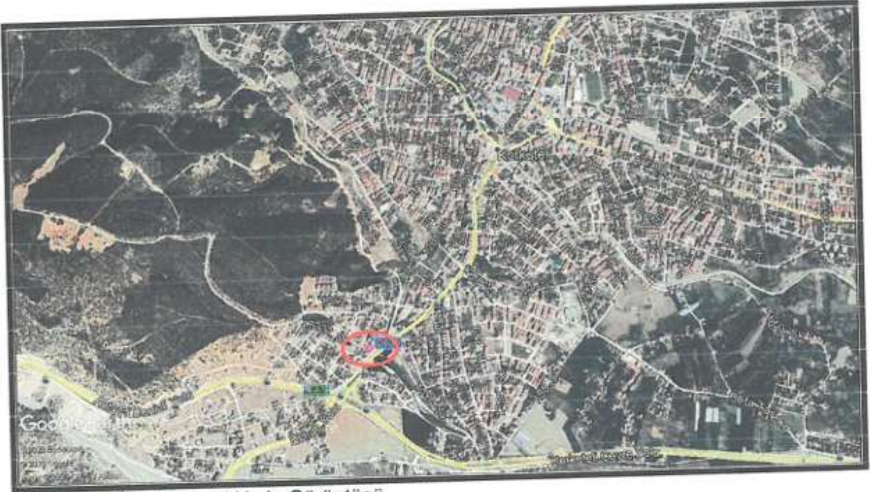
1. Korkuteli İlçe Merkezi Uydu Görüntüsü

Planlama alanı yaklaşık 602.61 m 2 olup Korkuteli merkezinden Elmalı istikametine gitmekte olan 26 metrelik ana yol güzergahına cephelidir.