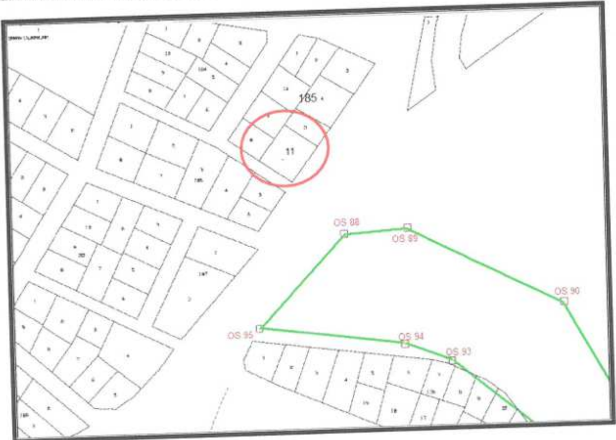
3. Kadastral Durumu

185 ada 11 nolu parsel, yürürlükteki 1/25000 Ölçekli Nazım İmar Planı N24-D3 nolu paftada "Mevcut Konut Alanı" içerisinde kalmaktadır.