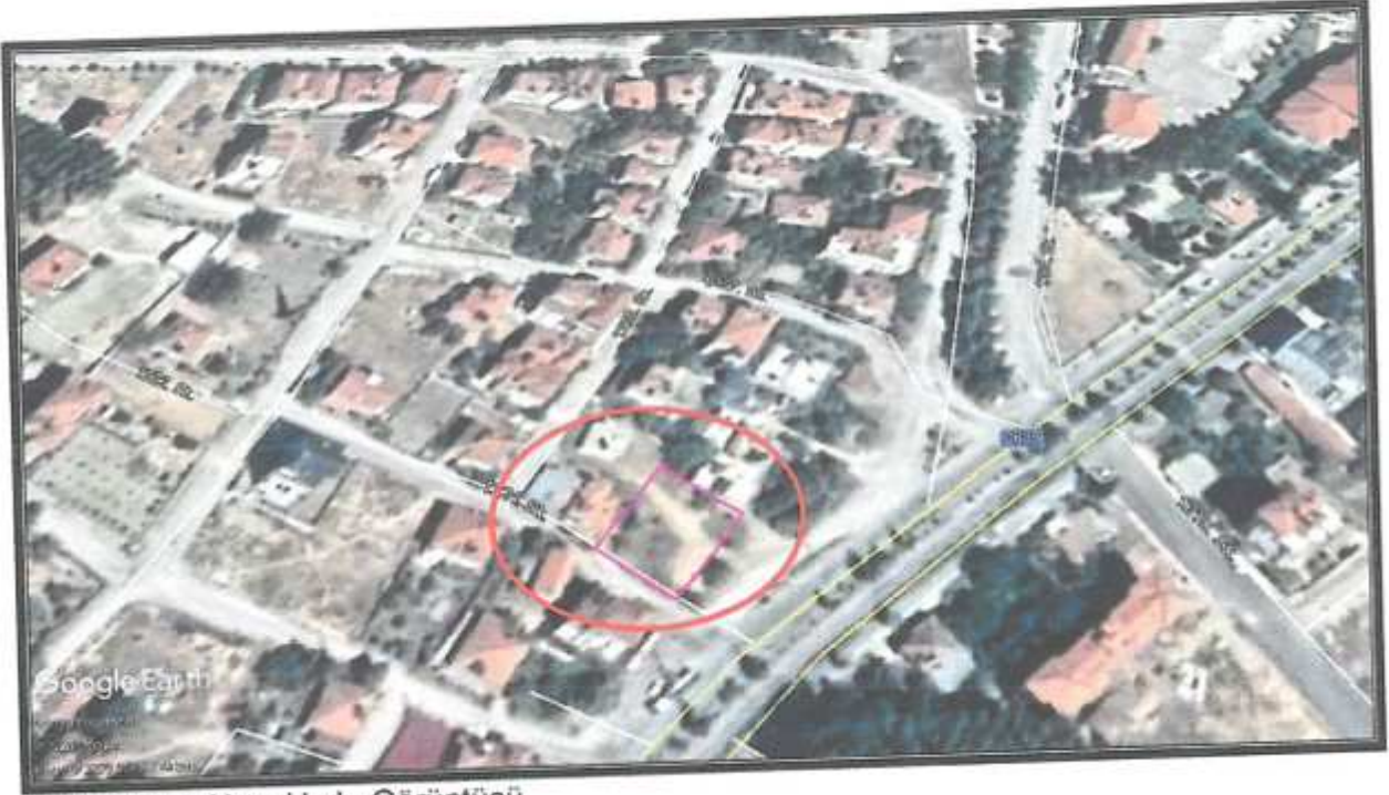
2. Planlama Alanı Uydu Görüntüsü