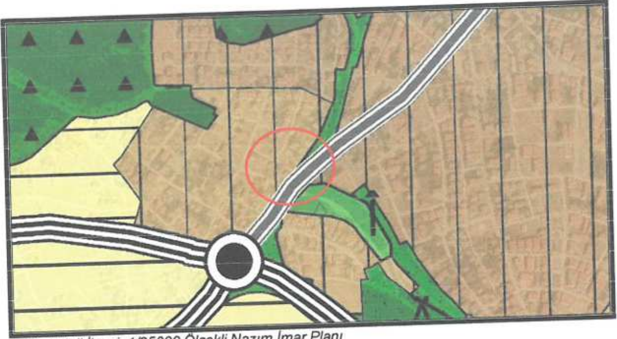
4. Korkuteli İlçesi 1/25000 Ölçekli Nazım İmar Planı

Planlama alanının bugünkü alan kullanımına bakıldığında boş ve atıl bir halde olduğu görülmektedir.