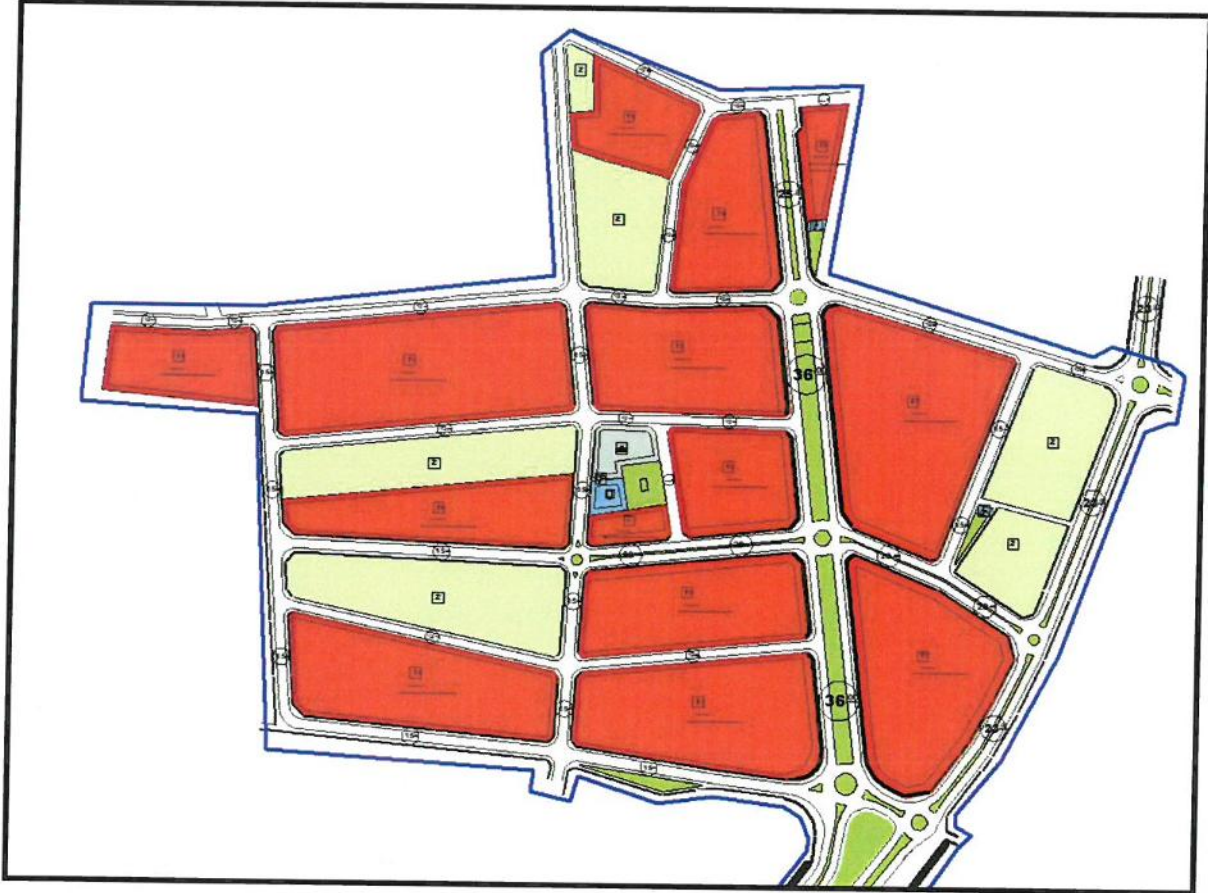
Resim 1: Mevcut 1/1000 Ölçekli Uygulama İmar Planı

Plan değişikliğine konu alan; Antalya İli, Kepez İlçesi, Kirişçiler Mahallesinde yer alan toplu işyeri alanını kapsamaktadır (Bkz: Resim 1 ve 2).