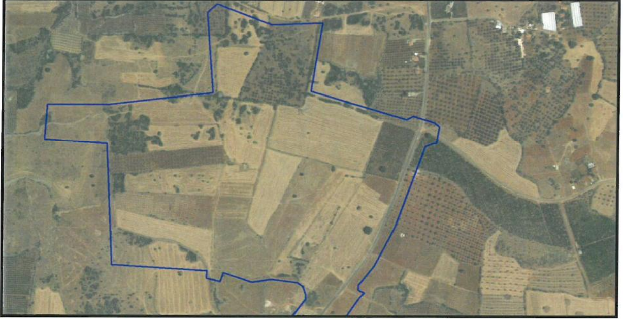
Resim 2: Uydu Görüntüsü

Antalya Sanayiciler İnşaat Malzemecileri Toplu İşyeri Yapı Kooperatifi'nin 18.03.2020 tarihli dilekçesi ile; Antalya İli, Kirişçiler mah., 30092, 30093, 30094, 30095 , 30096, 30097, 30098, 30099, 30100, 30101 numaralı adaların bulunduğu 1/1000 ölçekli uygulama imar planında toplu işyeri alanı olarak planlı, Yençok=7.50 (2 kat) yapılaşma koşuluna sahip olan bölgenin inşaat malzemelerinin boşaltılması ve yüklenmesinde iş makinelerinin sağlıklı çalıştırılabilmesi için yapılaşma koşulunun Yençok=11.50m. olarak değiştirilmesi talep edilmiştir.