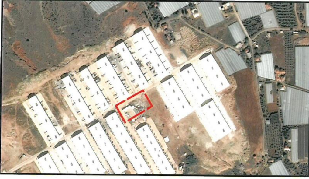
Resim 1: Uydu Fotoğrafı (2013)

Plan tadilatına konu alan; Antalya İli, Kepez İlçesi, Gaziler Mahallesinde O25B-1B-4D/4C nolu 1/1000 ölçekli uygulama imar planı paftalarında yer alan Gaziler Küçük Sanayi Sitesi içinde, camii alanı olarak planlı alanı kapsamaktadır (Bkz: Resim 1 ve 2).