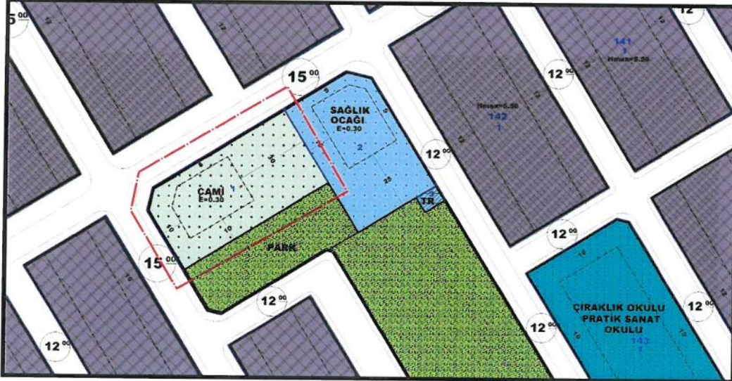
Resim 2: Mevcut Uygulama İmar Planı