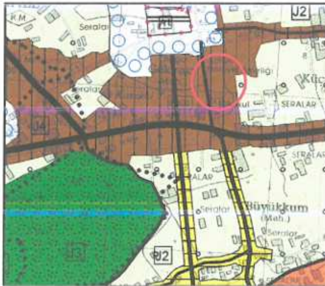
Plan 2 : Antalya Demre KTKGB 1/25.000 ölçekli Çevre Planı (ölçeksiz)

Gökyazı Mahallesi 389 ada batısını kapsayan alan Kültür ve Turizm Bakanlığınca 09.04.2018 tarihinde onaylanan Antalya Demre Kültür ve Turizm Koruma ve Gelişim Bölgesi (KTKGB) 1/25.000 ölçekli Çevre Düzeni Planı Revizyonunda "Kentsel Meskûn (Yerleşik) Alan" olarak planlıdır.