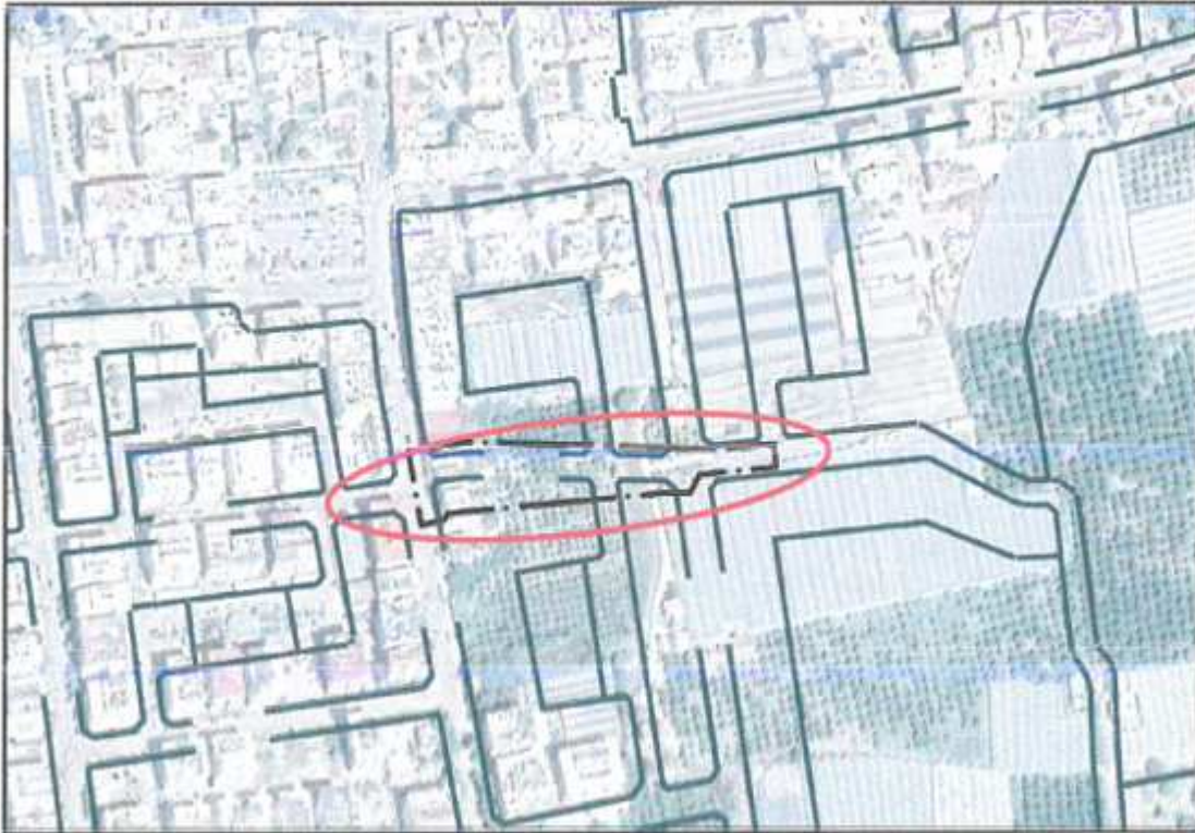
Resim 1: Planlama Alanına Konu Bölgenin Uzak Uydu Fotoğrafi

Demre Belediyesi, Gökyazı Mahallesi 369 adada mevcut imar planlarına göre Demre merkezden doğuya doğru yönelen 12 m genişliğinde taşıt yolu 369 adanın bulunduğu bölgede yol ve kavşak bağlantı noktaları kesişmemektedir.