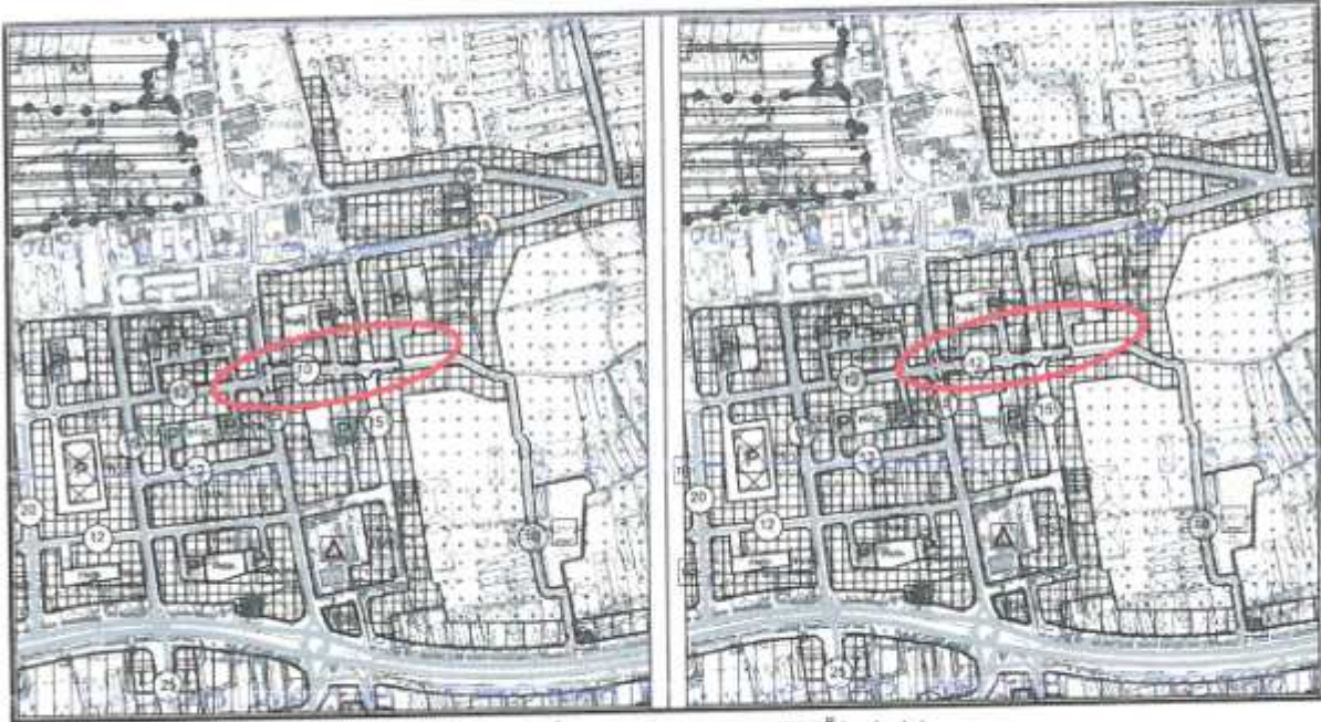
Plan 4: Mevcut-Öneri 1/5000 ölçekli Nazım İmar Planı Değişikliği (Ölçeksiz)