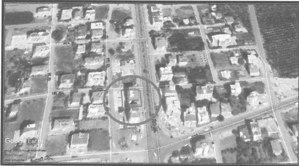
2. Uydü görüntüsü planlama alanı yakın çevresi