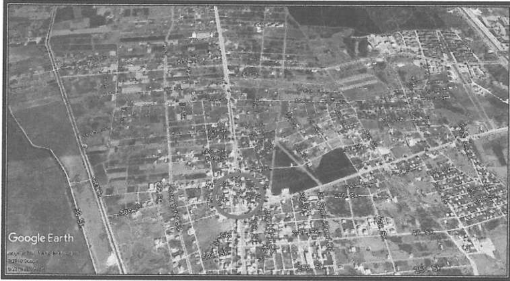
1. Uydü görüntüsü planlama alanı genel çevresi