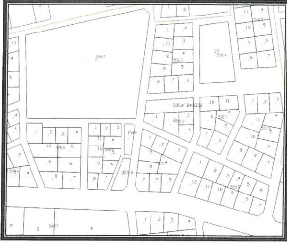
Şekil 2. Parselasyon Planı