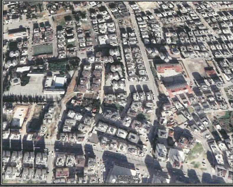
Şekil 1. Hava Fotoğrafı

Antalya İli, Muratpaşa İlçesi sınırları içerisinde Kızılarık mahallesi 20L-IA paftasında 5912 ada kuzeyinde imar planında çocuk bahçesi alanında mevcut trafo alanının planlanması amacı ile 1/1000 ölçekli Uygulama İmar Planı Değişikliği hazırlanmıştır.