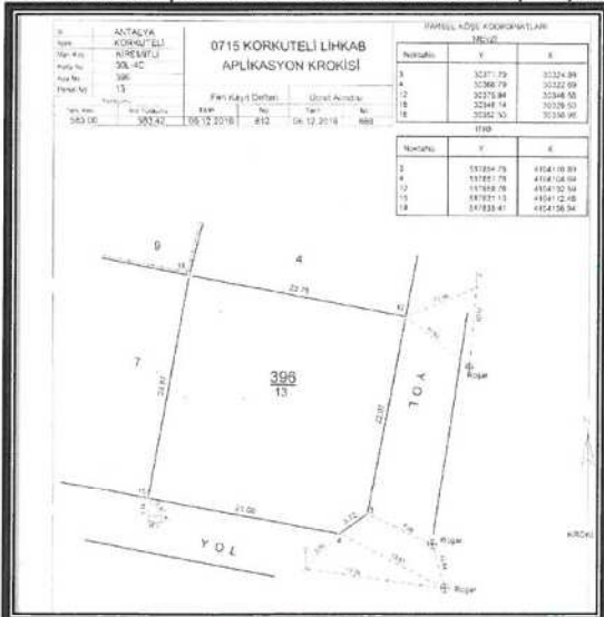
Şekil 2. Kadastral durum ve parsel ölçüleri

Söz konusu parseller arsa vasfında olup toplam alanı 583 metrekaredir.