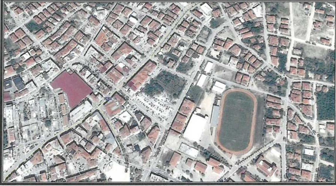
Şekil 1. Hava Fotoğrafi

Antalya İlçesi, Korkuteli Belediyesi, Kiremitli mahallesi sınırları içerisinde yer alan N24D 20D 1D paftasında yer alan, 396 ada 13 parsel 1/1000 ölçekli uygulama imar planında yüksek zemin katlı ticaret ve konut kullanımında kalmaktadır. Söz konusu parsel için yapılanma koşulları 1/1000 ölçekli uygulama imar planında blok nizam, 4 kat olarak belirlenmiştir.