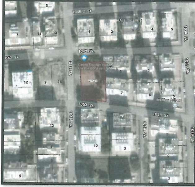
Uydu Fotoğrafı ve Kadastral Durum

Plan değişikliğine konu alan; Muratpaşa ilçesi Kızıltoprak Mahallesi sınırları içerisinde, 20L-1D nolu 1/1000 Ölçekli Uygulama İmar Planı paftalarında kalmaktadır. Söz konusu parselin kuzeyinde 1042 sokak, batısında 1048 sokak ve güneyinde ise 1053 nolu sokağa cepheli konumda yer almaktadır.