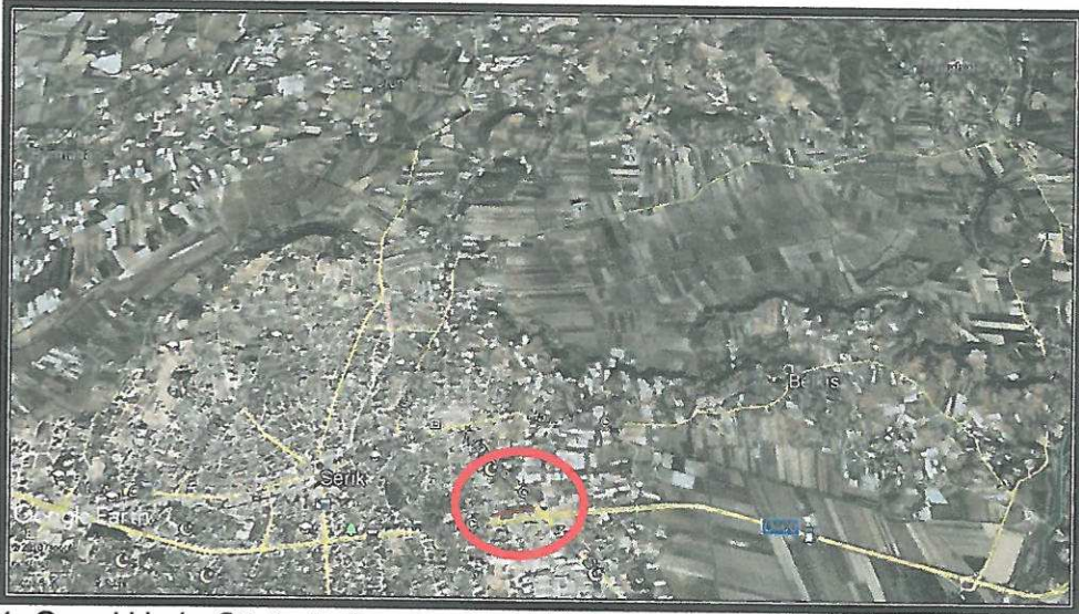
1. Genel Uydu Görüntüsü

Planlama alanı yaklaşık 26331.00 m 2 dir.