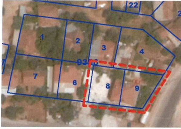
Resim 1: Uydu Fotoğrafi (2013)

Plan değişikliğine konu alan; Antalya İli, Kepez İlçesi, Fevzi Çakmak Mahallesi, O25-A-10-A-1-A ve O25-A-10-A-1-D nolu 1/1000 ölçekli uygulama imar planı paftalarında yer konut parsellerini kapsamaktadır (Bkz: Resim 1 ve 2).