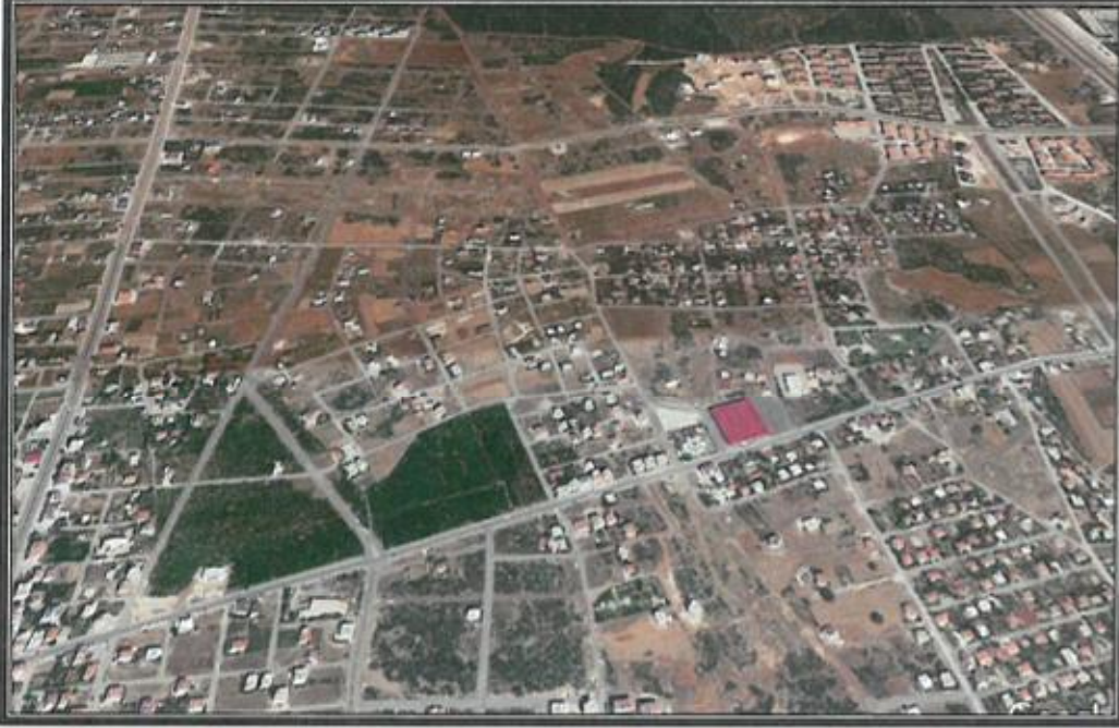
Şekil 1. Hava Fotoğrafi

Antalya İli, Döşemealtı İlçesi sınırları içerisinde N25D 23A 1C paftasında yer alan 408 adanın kuzeyinde park alanı içerisinde bulunan trafo alanının alan büyüklüğü değişmeden yine aynı alan içerisinde park alanının güneyinde trafo alanı olarak planlanmasına yönelik 1/1000 ölçekli Uygulama İmar Planı Değişikliği hazırlanmıştır.