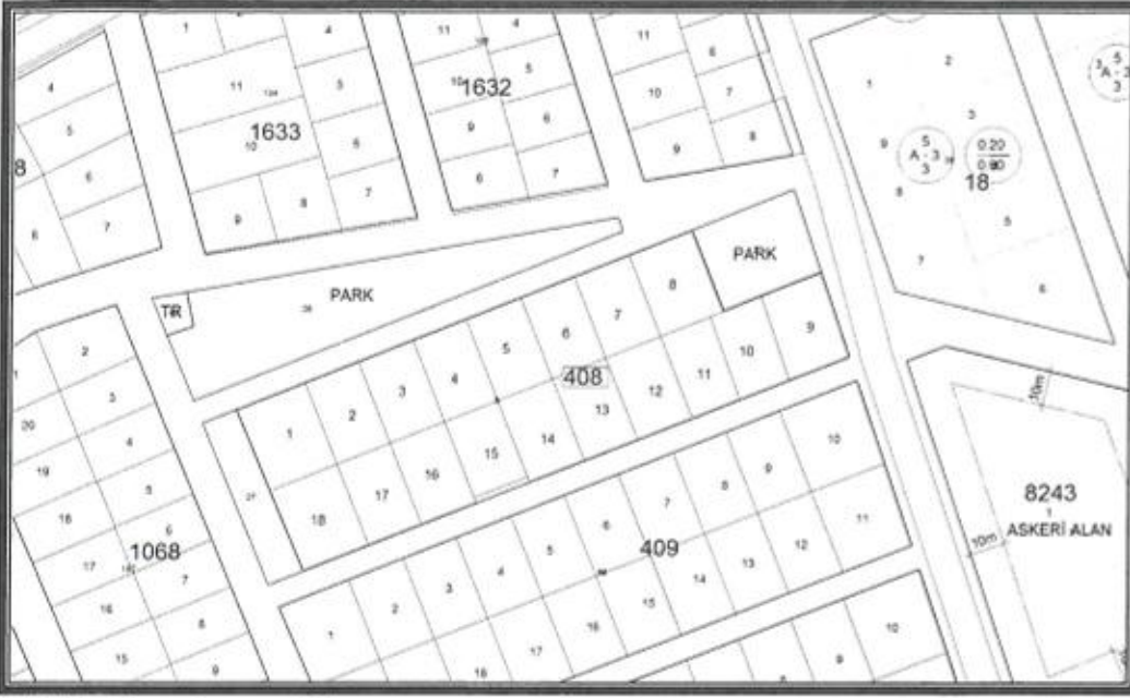
Şekil 2. Parselasyon Planı