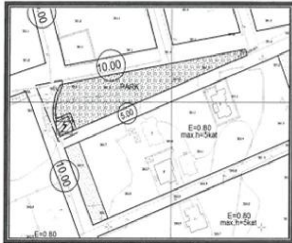
Şekil 4. Öneri 1/1000 ölçekli Uygulama İmar Planı