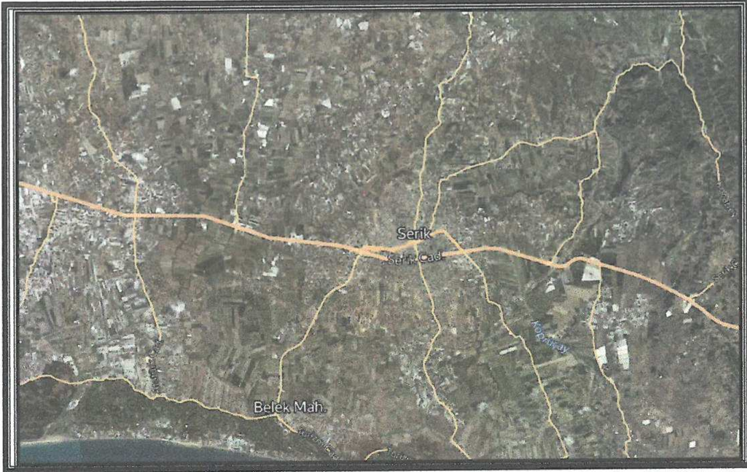
1. Genel Uydu Görüntüsü

Planlama alanı Serik İlçesi Gebiz Mahallesi planlama sahasını kapsamaktadır. Plan notu değişikliği N25C-19B-3A nolu 1/1000 ölçekli 1/1000 ölçekli plan paftasında yer almaktadır.