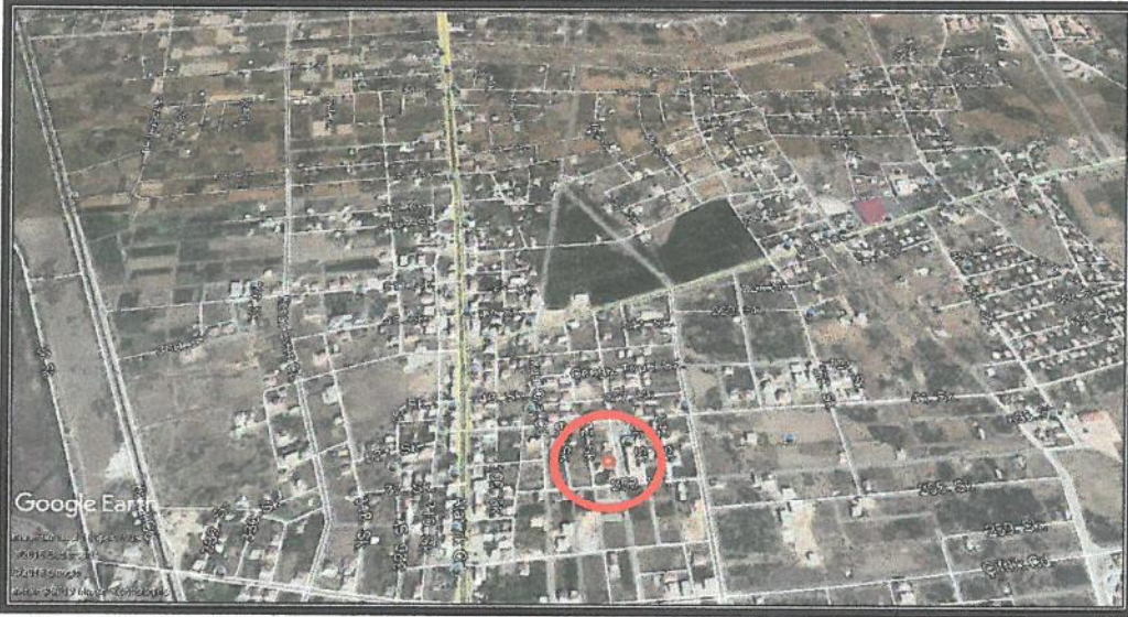
1. Uydu görüntüsü planlama alanı genel çevresi