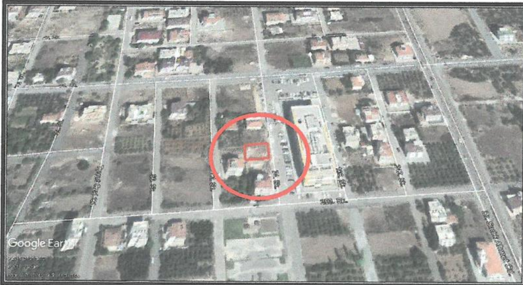
2. Uydu görüntüsü planlama alanı yakın çevresi