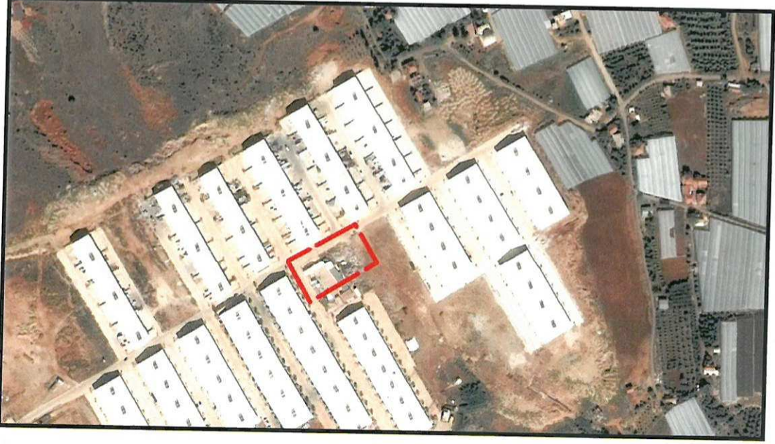
Resim 1: Uydu Fotoğrafi (2013)

Plan tadilatına konu alan; Antalya İli, Kepez İlçesi, Gaziler Mahallesinde O25B-1B nolu 1/5000 ölçekli nazım imar planı paftalarında yer alan Gaziler Küçük Sanayi Sitesi içinde, ibadet alanı olarak planlı alanı kapsamaktadır (Bkz: Resim 1 ve 2).