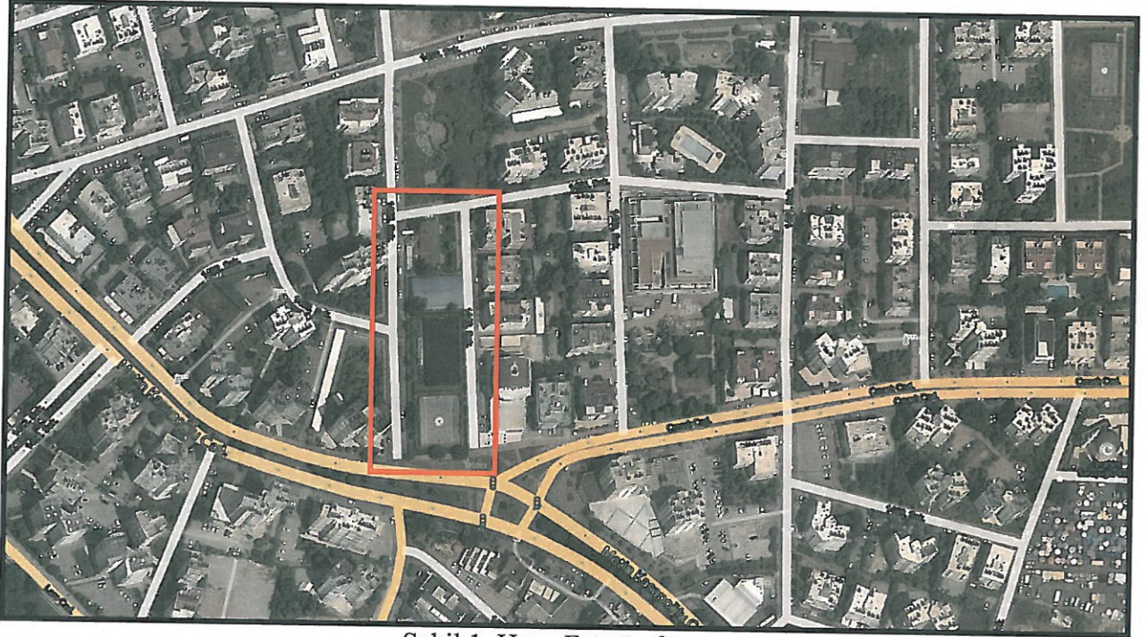
Şekil 1. Hava Fotoğrafi.

Planlama alanı Antalya İli, Muratpaşa İlçesi, Demircikara (Yeşilbahçe) Mahallesi sınırları içerisinde 19L-4a ve 19L-4d nolu 1/1000 ölçekli uygulama imar planı paftalarında 5562 ada 12 parselin batısında yer almaktadır.