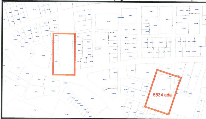
Şekil 3. Kadastral Durum

Planlama alanına ilişkin kadastral durum aşağıdaki haritada verilmiştir.