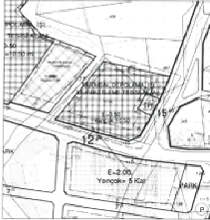
Şekil.2 Öneri Uygulama İmar Planı

Antalya İli, Finike İlçesi sınırları içerisindeki Çavdır Mahallesi 276 ada 1 parsel de bulunan yaklaşık 3794 m 2 (0,3 ha)lık ticaret alanı kaldırılarak yerine Tarım ve Hayvancılık Tesis Alanı yapılmıştır.