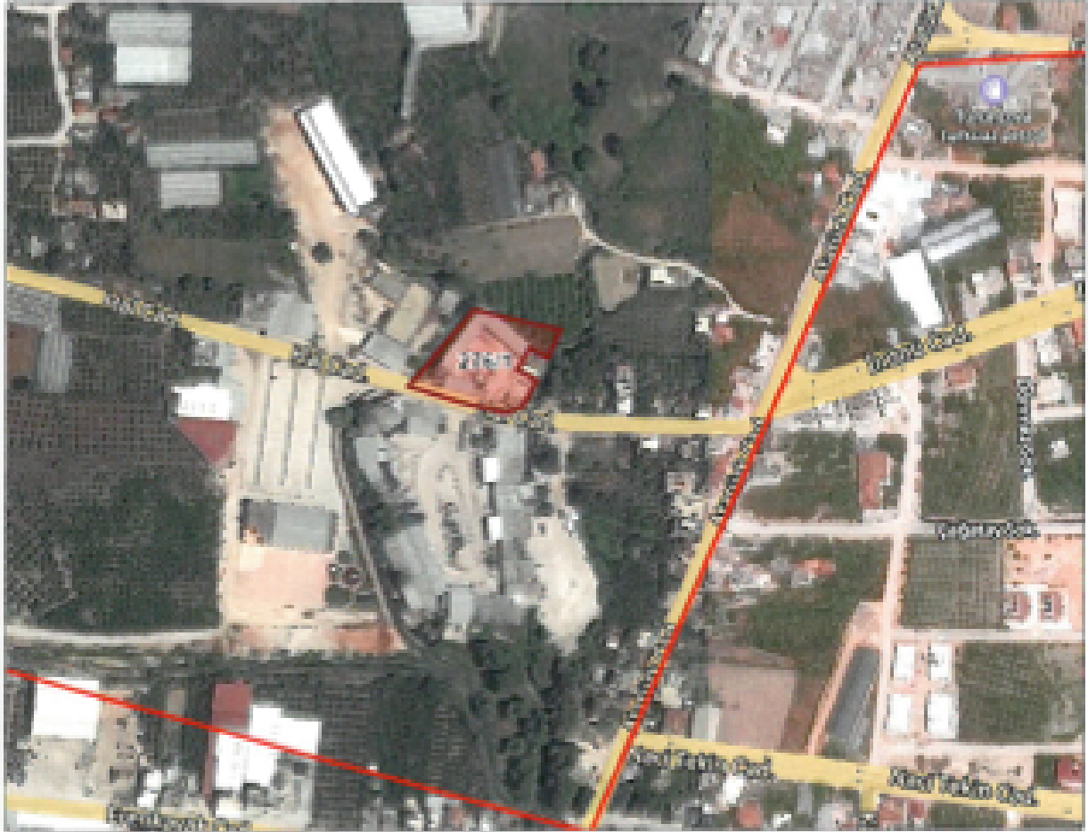
Şekil.1 Hava Fotoğrafi

Planlama alanı 20K-III nolu 1/1000 ölçekli Uygulama İmar Planı paftası içerisinde kalmaktadır.