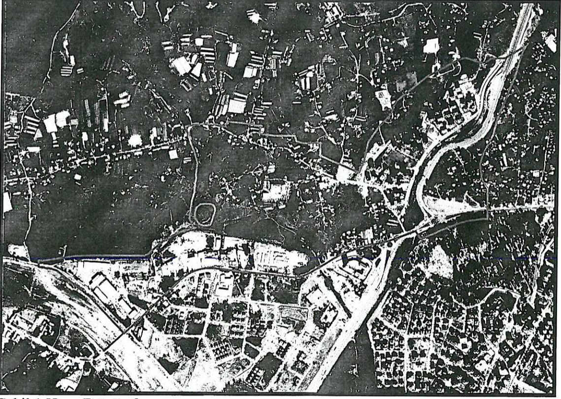
Şekil.1 Hava Fotoğrafı

Planlama Alanı Antalya İli, Kepez İlçesi sınırları içerisindeki Duraliler Mahallesi ve yakın çevresini kapsamakta olup O25A-08C, 08D, 13A nolu 1/5000 ölçekli Nazım İmar Planı paftaları içerisinde kalmaktadır.