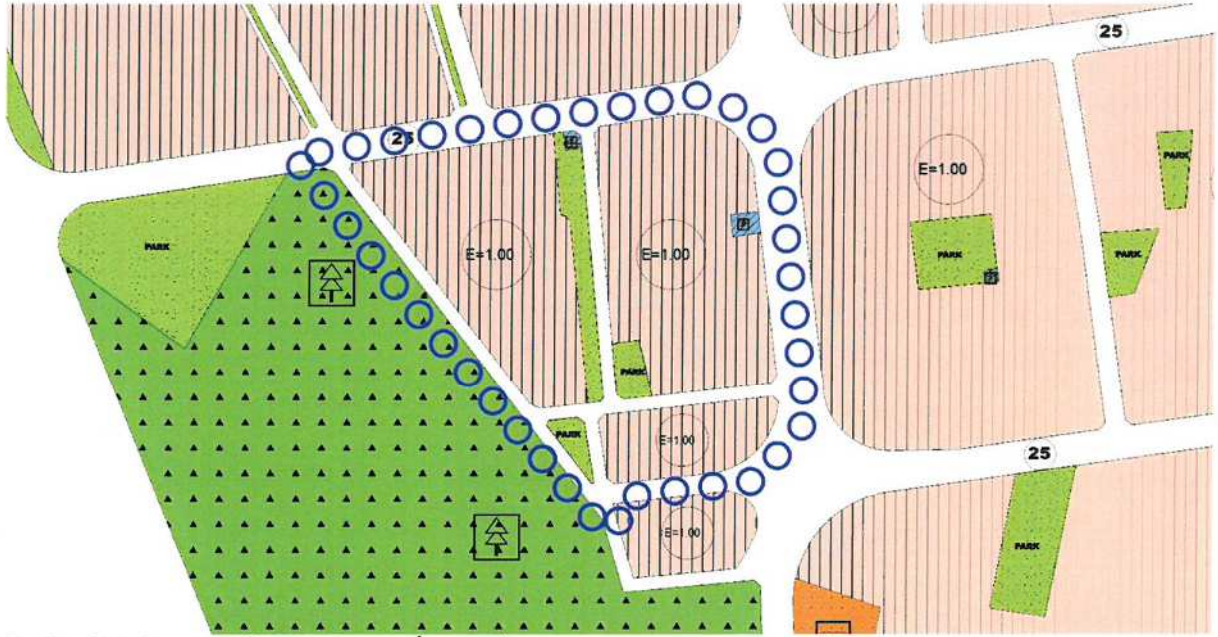
Resim 3: Mevcut 1/5000 Nazım İmar Planı