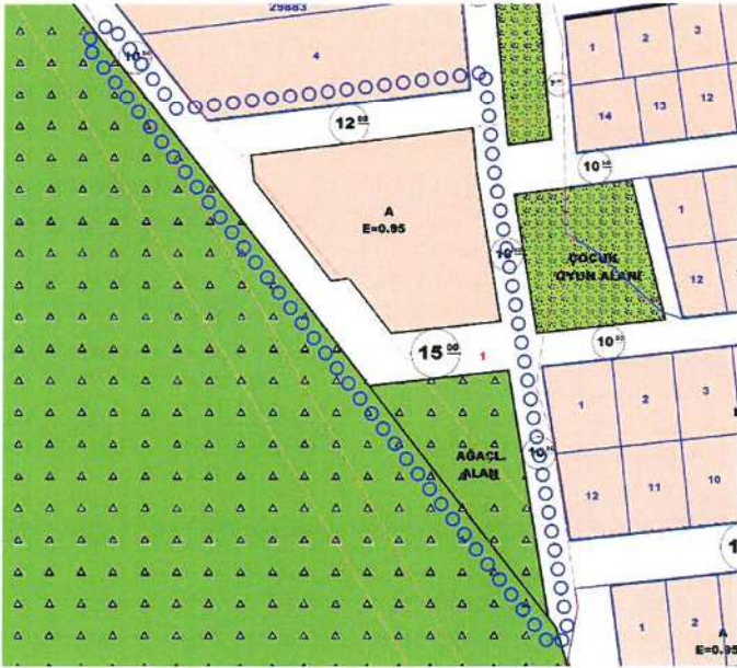
Resim 2: Mevcut 1/1000 Ölç. Uygulama İmar Planı

5 nolu parsel üzerinde daha önce onaylanan 1/1000 ölçekli uygulama imar planında imar uygulaması yapılmak istenmiştir ancak uygulama yapılmak istenen konut alanı orman sınırlarında kalmakta ve zayıyat oranı % 45'ten fazla çıkmaktadır (Bkz: Resim 2). Bu nedenle bu alanda plan değişikliği yapılması gündeme gelmiştir. Bu plan değişikliğinin yapılabilmesi için öncelikle 1/5000 ölçekli nazım imar planının değiştirilmesi gerekmektedir (Bkz: Resim 3).