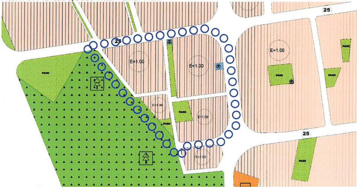
Resim 4: Öneri 1/5000 Ölçekli Nazım İmar Planı

Plan revizyonu öncesi ve sonrasına ait fonksiyonların alan değişimi tablosu aşağıdaki gibidir.