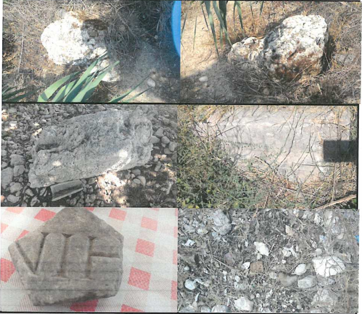
Resim 11: Seramik Parçaları ve İnsitü Olmayan Antik Blok Taşlar

Yolun doğusunda yer alan III. Derece Arkeolojik Sit Alanında ; 520 Ada 179-180 (eski 4020-4021) parsellerde yerinde yapılan incelemelerde, yüzeyde seramik parçaları ve insitü olmayan antik blok taşlar görülmüştür. Bu alanda meyve ağaçları yer almakta ve sezonluk tarım yapılmaktadır.