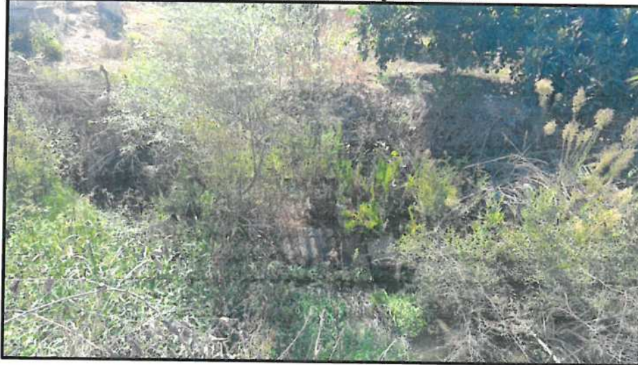
Resim 9: DSİ Su Kanalı İçinde Görülen Yapı Kalıntısı-1

Antik yapı kalıntısı: I. derece arkeolojik sit alanında ayrıca DSİ su kanalı içinde ne amaçla kullanıldığı anlaşılamayan bir antik yapının iri, düzgün kesimli blok taşlarla yapılmış duvar kalıntıları görülmektedir.