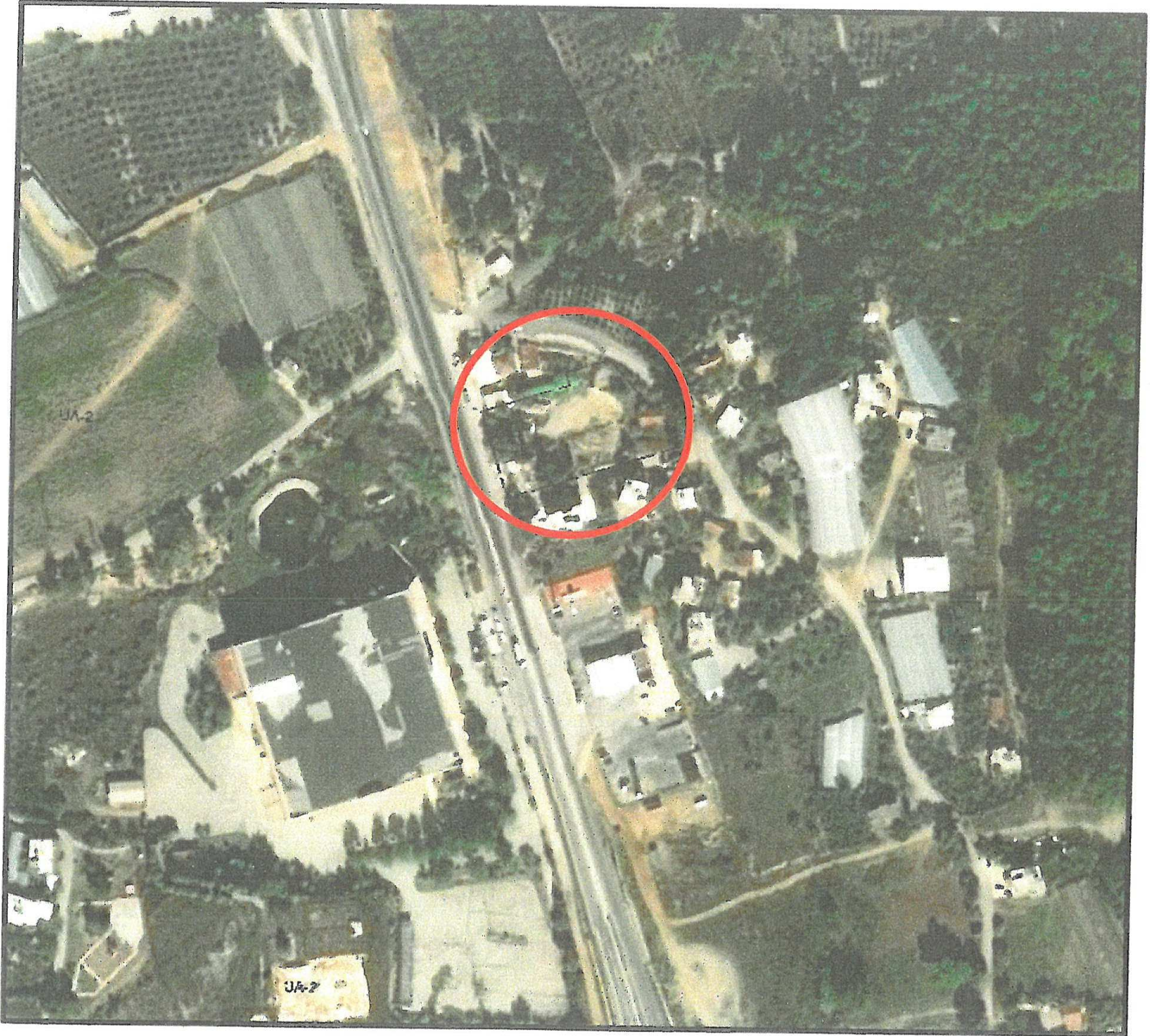
Resim 1: Uzak Uydu Fotoğrafi

Antalya Büyükşehir, Aksu Belediyesi Konak Mahallesiinde bulunmaktadır. Planlama alanının 04.01.2019 tarihli 18 nolu Meclis Kararıyla 1/1000 Ölçekli Antalya Büyükşehir Belediyesi Aksu İlçesi Macun, Konak, Cumhuriyet, Fatih Mahalleleri İlave ve Revizyon Uygulama İmar Planı onaylanmıştır. 25.01.2019 tarihinde plan askıya çıkmış. 26.02.2019 tarihinde plan askıdan inmiştir.